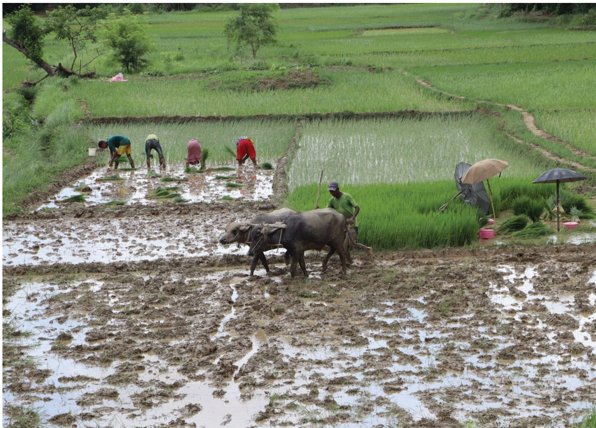
धान रोपण खेत | दाङको घोराही-४ का किसान धान रोपाईंका लागि राँगाको सहायताले खेत जोत्दै । पछिल्लो समयमा कृषिमा यान्त्रिकीकरण भए तयार गरिँदै पनि गोरु र राँगाको सहायतामा खेत जोत्ने गरिन्छ ।