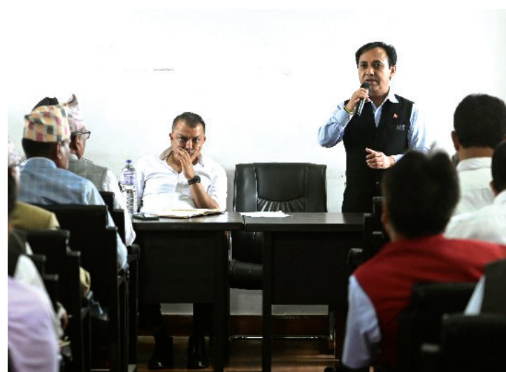
सानेपास्थित कांग्रेस केन्द्रीय कार्यालयमा भएको जिल्ला सभापतिहरूको भेलामा महामन्त्रीद्वय गगन थापा र विश्वप्रकाश शर्मा।

'एजेण्डा पनि खासै केही थिएनन्, म पहिलो दिन ढिला पुगे, दोस्रो दिन गइँ, ती सभापतिले भने। एजेण्डा