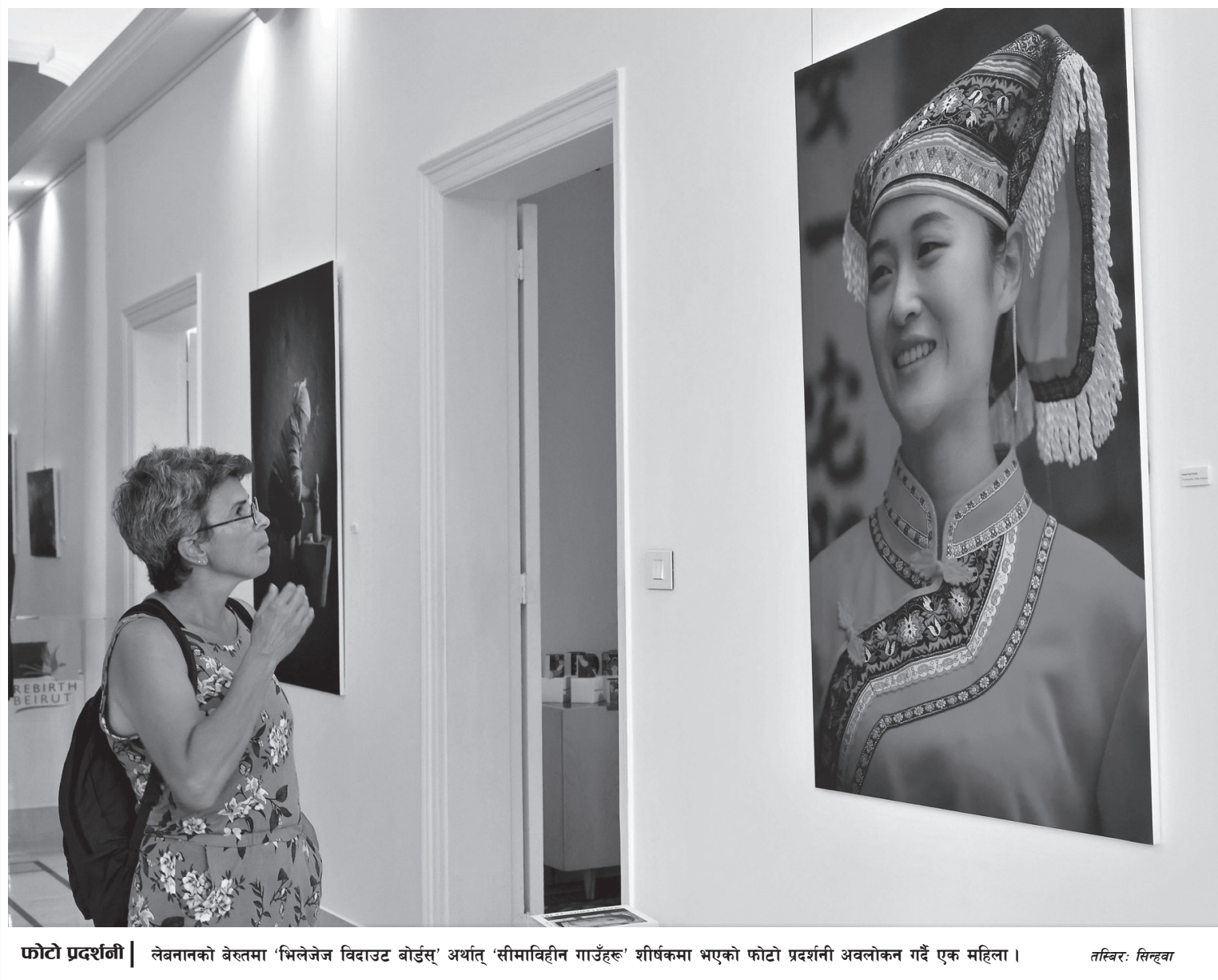
फोटो प्रदर्शनी | लेबनानको बेरुतमा 'भिलेजेज विदाउट बोर्डर्स' अर्थात् 'सीमाविहीन गाउँहरू' शीर्षकमा भएको फोटो प्रदर्शनी अवलोकन गर्दै एक महिला।