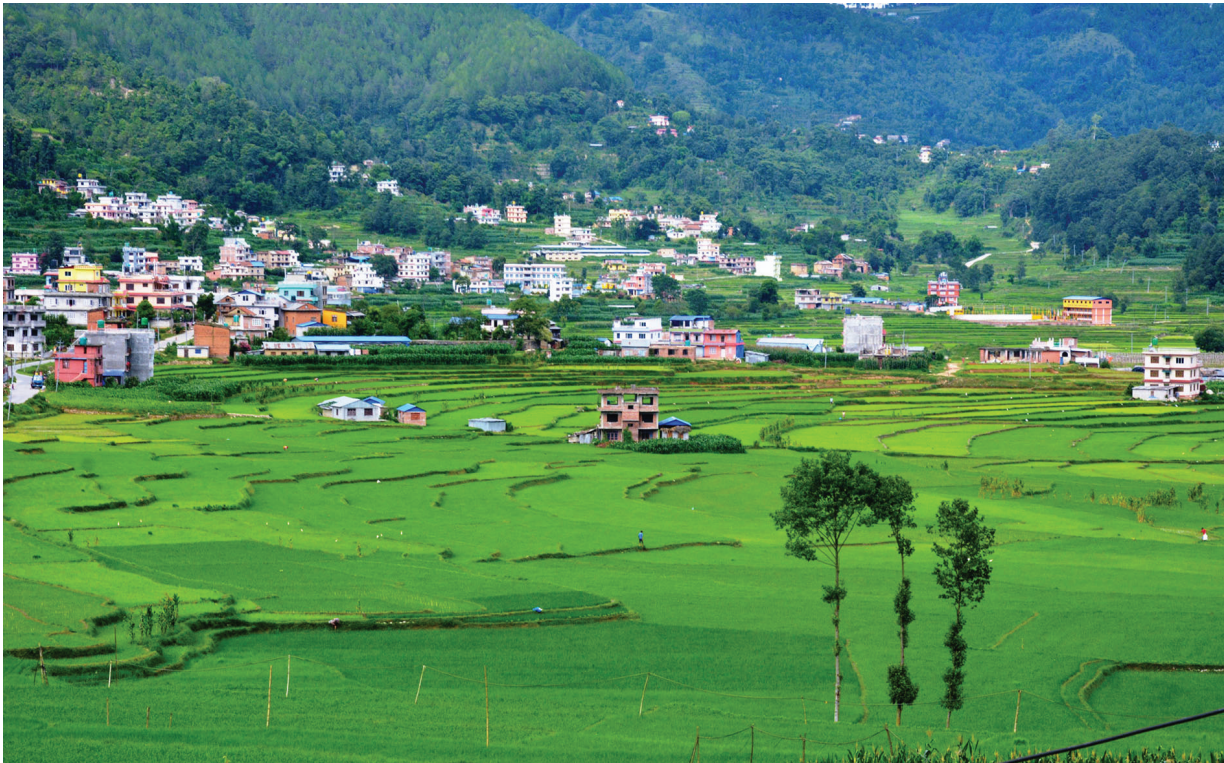
हरियाली शस्फाट | धान खेतीले सुन्दर हरियाली देखिएको काभ्रेपलाञ्चोकको धुलिखेल नगरपालिका-१० स्थित शंखु फाँट।