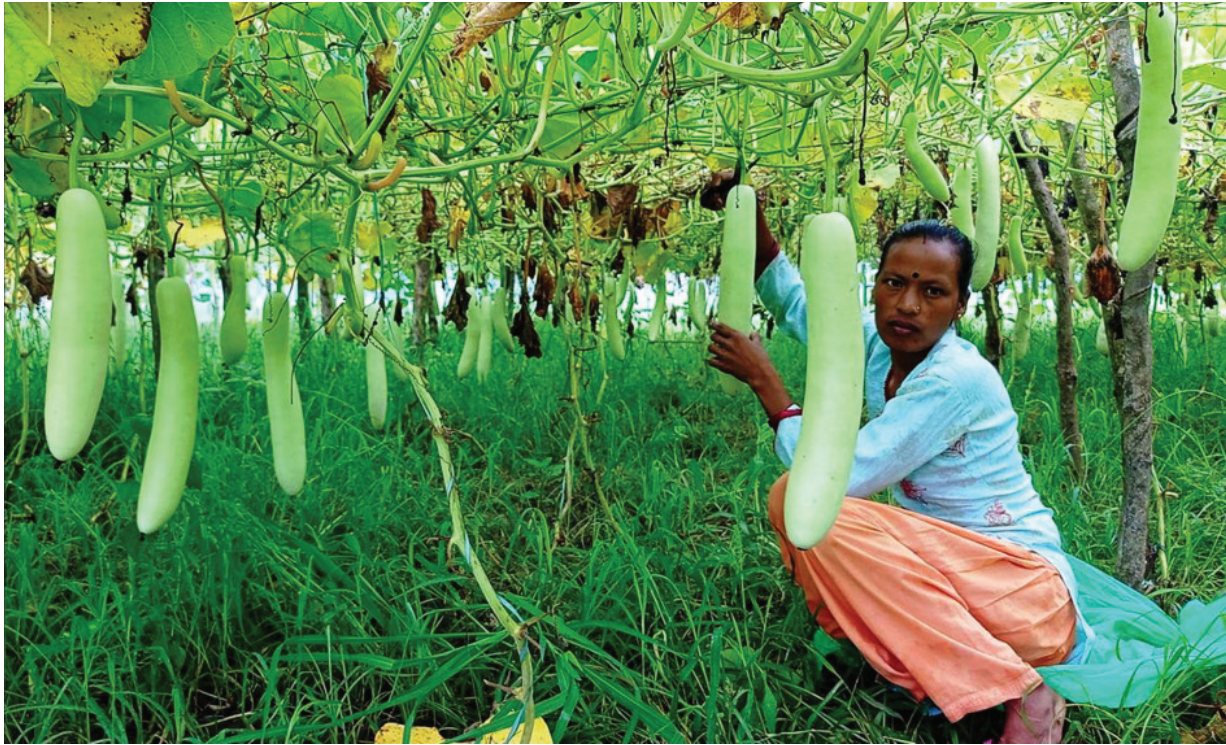
लौका देखाउँदै कृष्णपुर नगरपालिका-१ का किसान महिला बारीमा उत्पादन भएको लौका देखाउँदै। यस क्षेत्रका महिलाहरू व्यावसायिक तरकारी खेतीमा संलग्न भएर राम्रो आम्दानी लिन आएका छन्।