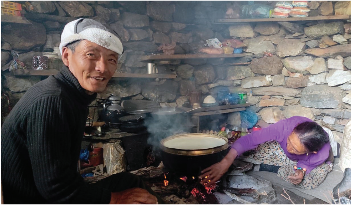
चौरीको दूधबाट छुपी पकाउँदै चोरीपालक कृषक । यसरी बनाएको छुपी प्रतिकेजी दुई हजार ७०० देखि तीन हजार रूपैयाँसम्ममा बिक्री हुनेगर्छ ।