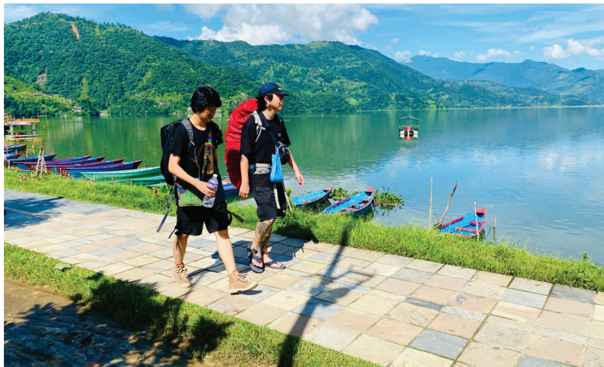
पोखरास्थित फेवाताल किनारमा पैदलयात्रा गर्ने विदेशी पर्यटक ।