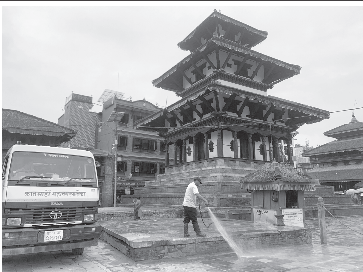
पर्यटकीय क्षेत्र वसन्तपुर तर्फ सरसफाई | काठमाडौं महानगरपालिका-२४ पर्यटकीय क्षेत्र वसन्तपुरमा रहेका मठमन्दिर वरपर डबली तथा सडकको सरसफाई गर्दै कामपाका कर्मचारी।