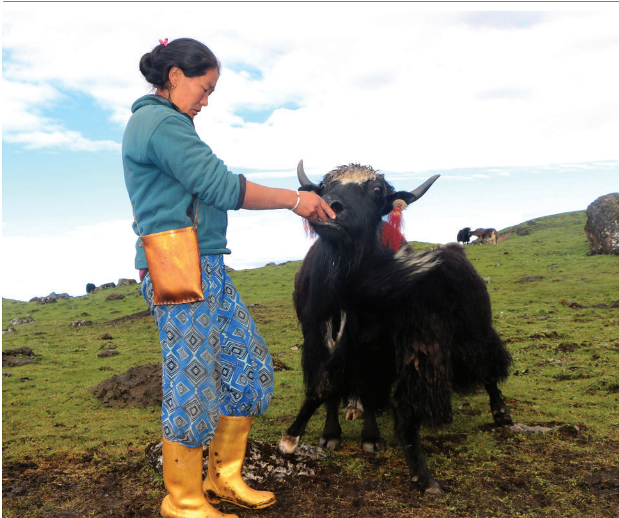
याकलाई ताप्लेजुङको भिक्वाखोला गाउँपालिका-५ लोदेन क्षेत्रमा रहेको खर्कमा याकलाई नुन खुवाउँदै महिला। याक पालन हिमाली क्षेत्रका नुन खुवाउँदै समुदायको मुख्य पेशा हो।