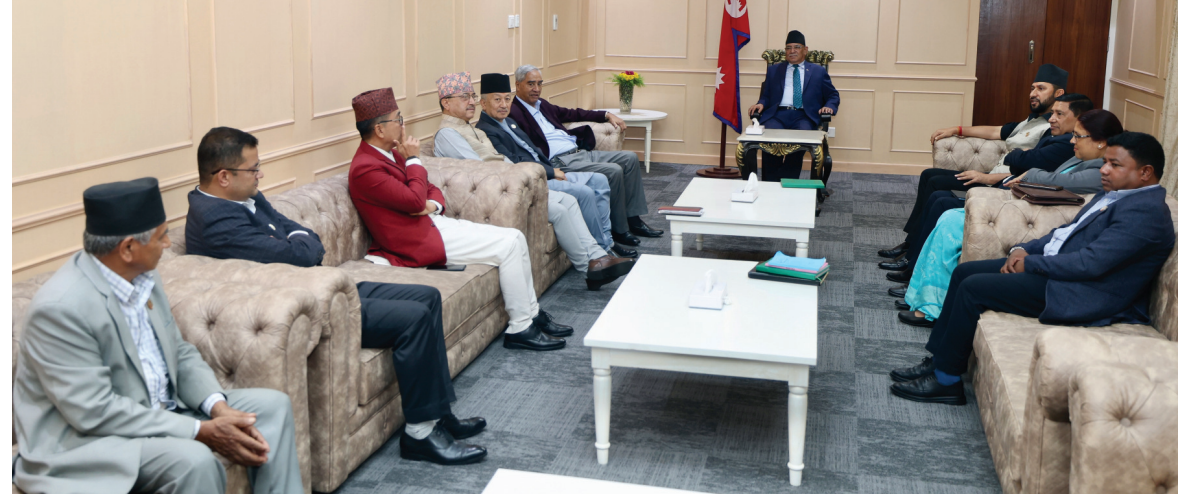
संसद् अवरुद्धका सम्बन्धमा राष्ट्रिय मान्यताप्राप्त दलका नेताहरूसँग आइतबार सिंहदरबारमा छलफल गर्दै प्रधानमन्त्री पुष्पकमल दाहाल ।

लागि स्थगित गरिएको छ । संघीय संसद् सचिवालयले अपराह्न ३ बजे बैठक स्थगित गरेको सूचना टाँसेको थियो । बैठक भदौ ५ गते दिउँसो ३ बजे बस्ने सूचनामा उल्लेख छ । प्रतिनिधिसभा नियमावली, २०७९ को नियम ६ को उपनियम (३) बमोजिम सभाको अर्को बैठक यही ५ गते मंगलबारसम्म सारिएको संसद्का महासचिवद्वारा जारी सूचनामा उल्लेख छ ।