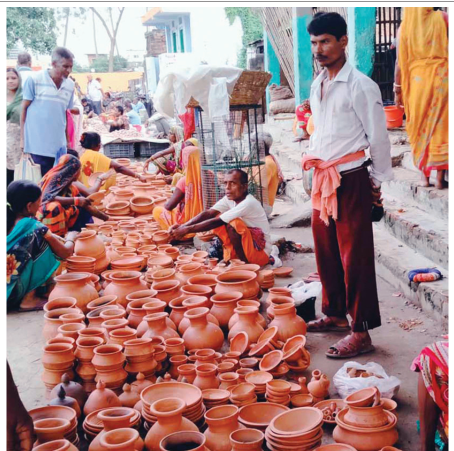
माटाको महोत्सव जिल्लाको सदरमुकाम जलेश्वर नगरपालिका-२ स्थित हटियामा माटाका बाँडाकुँडा बिक्री भइरहेको छ।