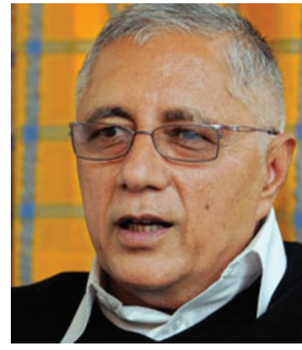
भाग लिएकामा आपत्ति जनाए । असार २२ गते थापा पहिलोपटक मुख्यमन्त्री नियुक्त