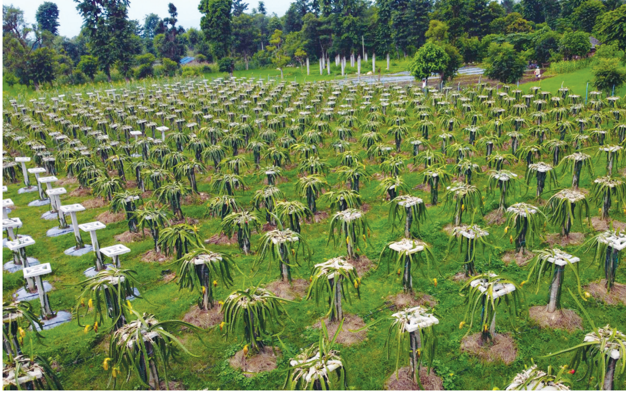
इंगान खेती सुर्खेतको गुर्भाकोट नगरपालिका-१४ विशालचोकमा रहेको इंगान फूट खेती। उक्त इंगान खेती एक विद्या क्षेत्रफलमा रहेको छ।