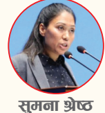
सुजना श्रेष्ठ सांसद, रास्वपा

कानुनीरूपमा मात्रै होइन, देशकै व्यवस्थाको नयाँ परिभाषा हुनसक्ने, राजनीतिलाई नै नयाँ दृष्टिकोणबाट हेर्न बाध्य बनाएर राख्ने ठुँदा (६४) लाई विधेयकको बीचमा सुटुक्क छिराइएको छ ।