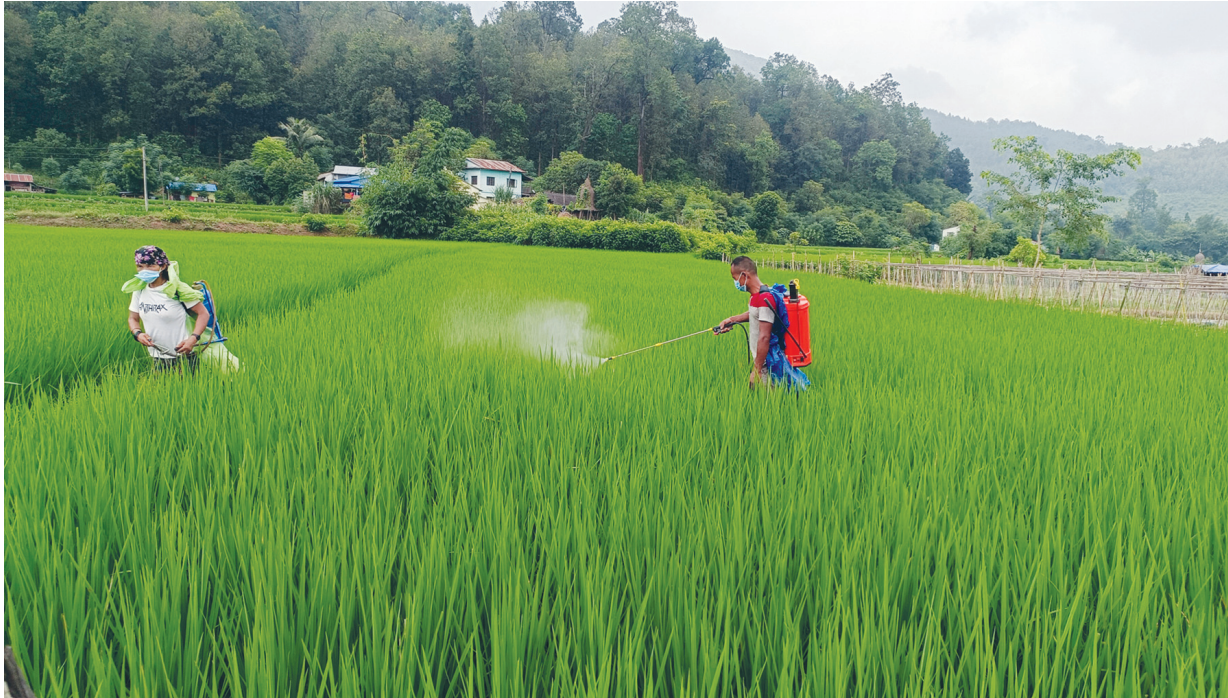
धान रोग लागेपछि धान खेतीमा रोग लागेपछि कीटनाशक विषदी छर्दै नवलपरासी (बर्दघाट सुस्तापूर्व) हुसेकोटका किसान । रोग लागेर बोट विषदी छर्किँदै नसर्ने, पात रातो हुने तथा बोट मर्ने गरेको किसानले बताएका छन् ।