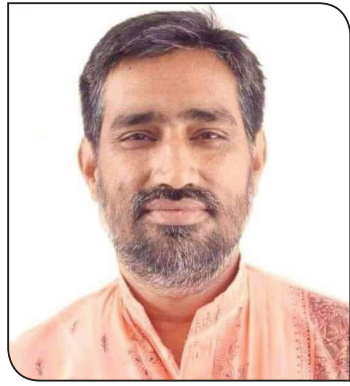
► धर्मन्द् भ्रा

नेपाली, मैथिली र हिन्दी भाषामा समान अधिकार राख्नुहुने नेपालीजी यी तीनै भाषाका माध्यमबाट पत्रकारिता र साहित्यमा क्रियाशील रहनुभयो । तीन भाषामा अनेक साहित्यिक रचना (पुस्तकसमेत)का स्रष्टा हुनुहुन्छ उहाँ । यतिमात्र होइन, उहाँको परिचय लोकतन्त्र र प्रेस स्वतन्त्रताका पक्षमा भएका आन्दोलनको एक अविश्रान्त योद्धाका रूपमा पनि छ । पत्रकार जगतले उहाँको योगदान स्वीकार गर्नु र केही थान सम्मान तथा पुरस्कार अर्पण गर्नु तर राज्य र सरकारले भने उहाँलाई सधैं उपेक्षा नै दियो ।