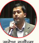
मधेश बर्तीला सचेतक, एमाले

हिशात्मक गतिविधिलाई प्रोत्साहित हुनेगरी ल्याइएको विधेयक स्वीकार्य हुँदैन । हिशात्मक गतिविधि गर्नेहरूको संरक्षक सरकार बन्न सक्दैन ।