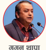
गगन थापा सांसद, काठमाडौं

मुलुकी फौजदारी अपराध संहिताको संशोधनमार्फत जघन्य अपराधमा संलग्नलाई जोगाउने प्रावधान ल्याइएको छ । राजनीतिको अपराधीकरण र अपराधको राजनीतिकरण स्वीकार्य छैन ।