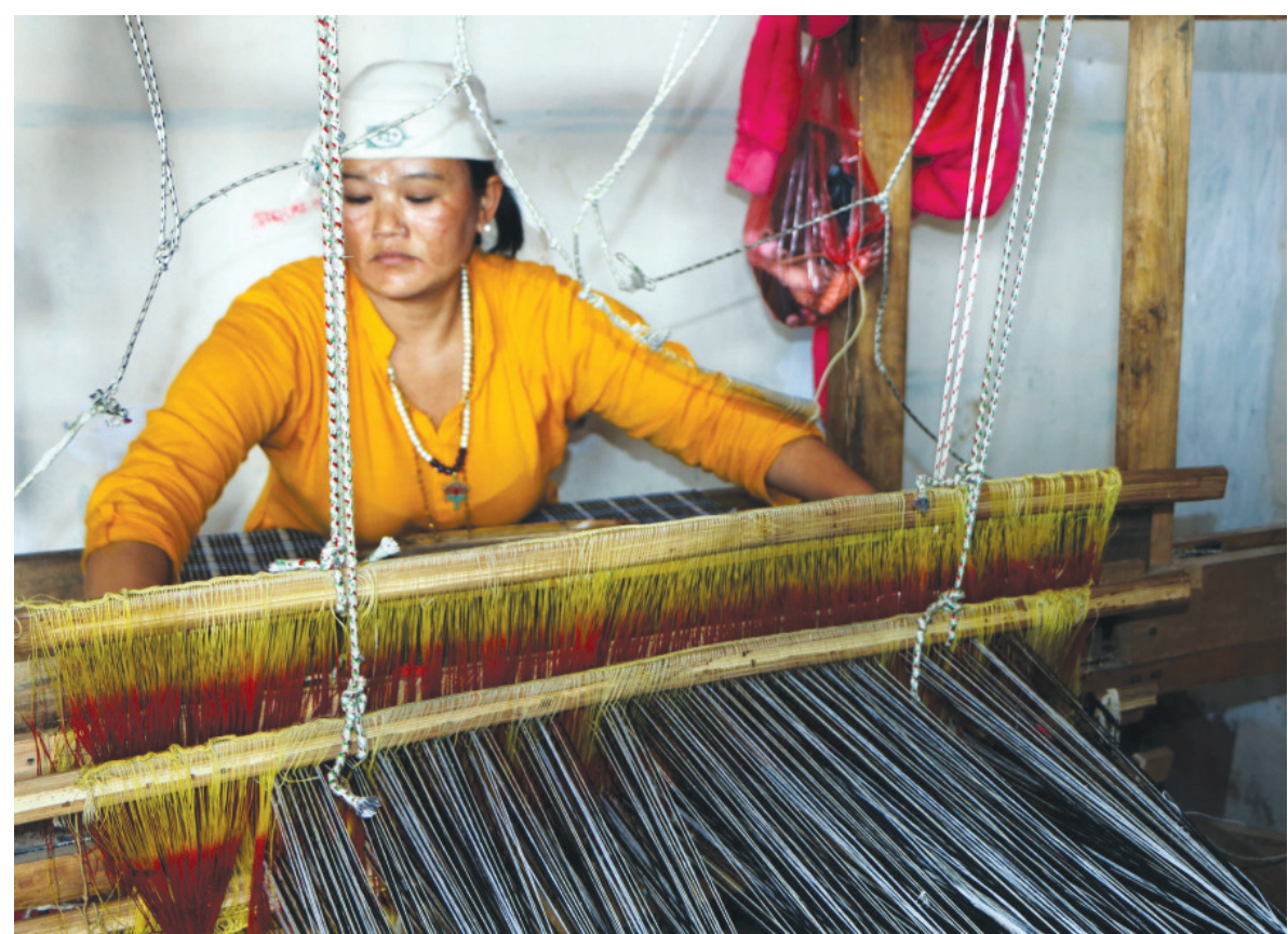
तानमा अल्लोको कपडा | तान्नेजुडको सदरमुकाम फुङ्लिङ-५ स्थित उत्तम उल्लो कपडा उद्योगमा तानमा अल्लोको कपडा बुन्दै एक उद्यमी महिला ।