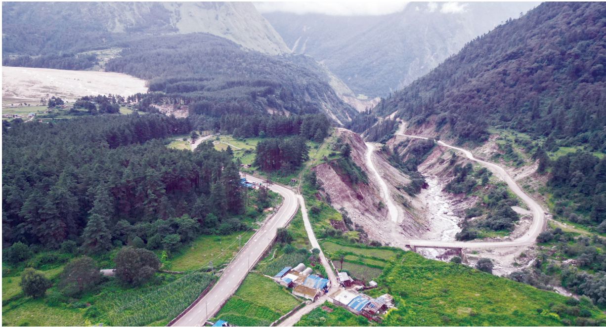
कालोपत्रे सडक र लेते गाउँ | बेनी-जोमसोम-कोरला सडक आयोजना अन्तर्गत मुस्ताङको लेतेमा कालोपत्रे गरेपछि चिटिक्क देखिएको सडक मोटरबल पुल र लेते गाउँ आसपासको दृश्य। यस आयोजनाले घाँसादेखि कोवाडसम्मको सडक कालोपत्रे गर्ने काम सकिएको छ।