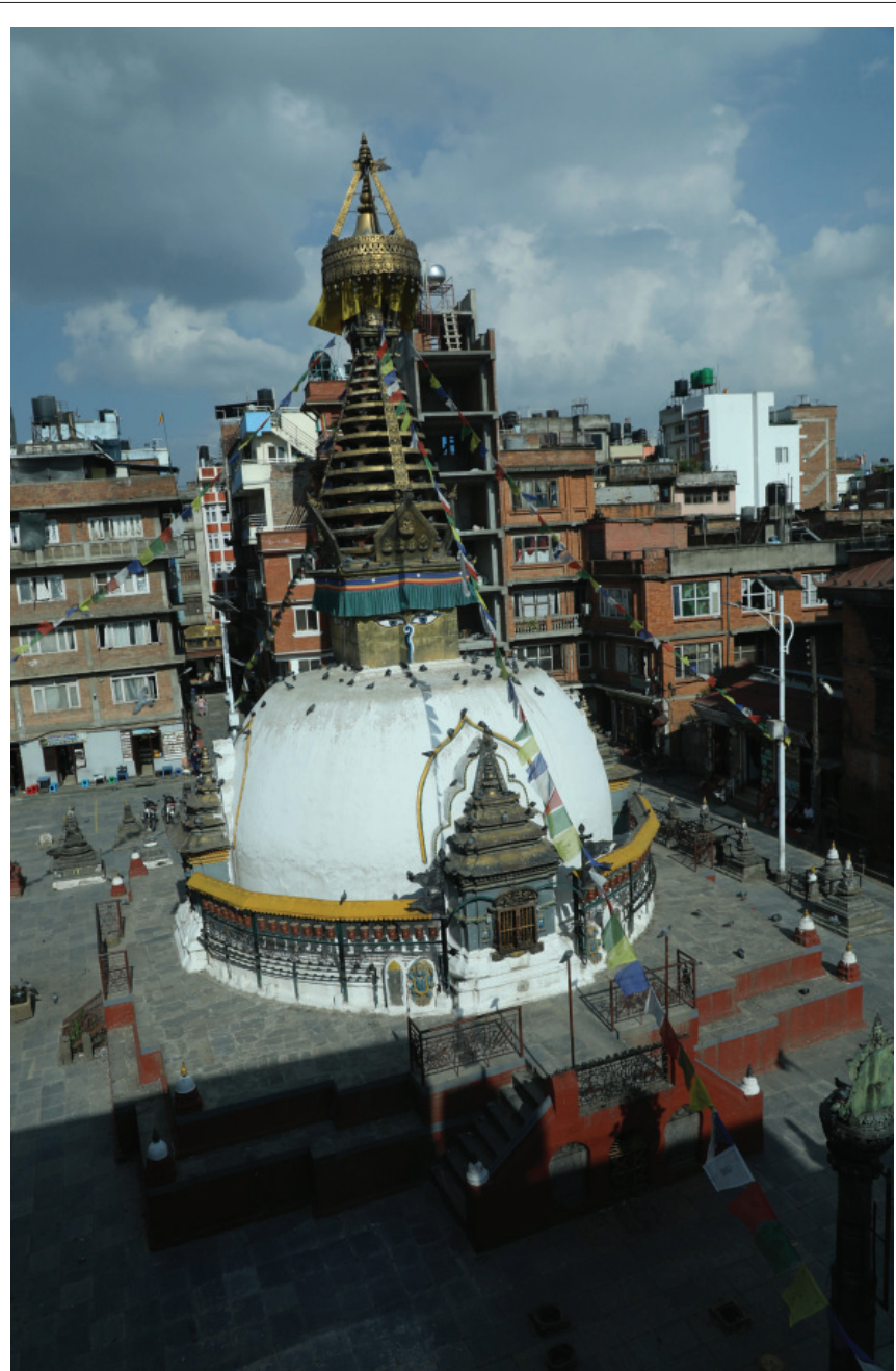
काठमाडौं महागरपालिका-२५ श्रीघः मा अवस्थित ऐतिहासिक काठे स्वयम्भू। सन् १९५० मा निर्माण गरिएको यो चैत्य तिब्बती तीर्थस्थलमध्ये एक मानिन्छ।