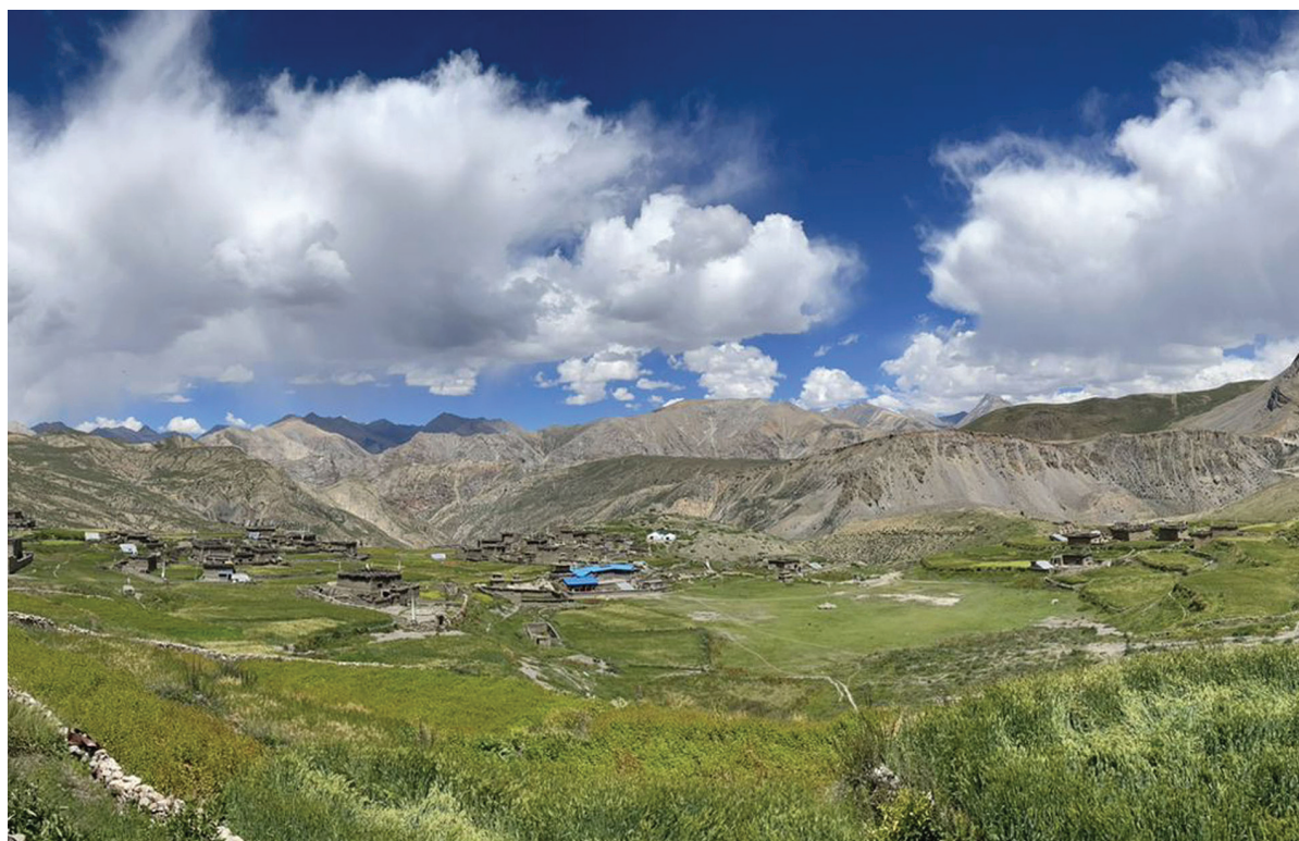
कोमाड गाउँ | उपल्लो डोल्पाको शे-फोक्सुण्डो गाउँपालिका-१ स्थित कोमाड गाउँ । यहाँको मुख्य पेसा भेंडा, बाखापालन हो । प्रत्येक घरमा १०० भन्दा बढी भेंडा, बाखापालन गरिन्छ भने खेतीको रूपमा वर्षमा एक वारी उवा पाक्ने गर्छ ।