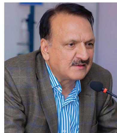
भनेर सरकारले निगरानी गरिरहेकोसमेत बताए । अर्को प्रश्नको जवाफ दिँदै उनले निजामती सेवा ऐनमा नै निजामती कर्मचारीले आफ्नो

साथै उनले सेयर बजारमा कुनै पनि व्यक्ति नरिजिस्ट्रर र कसैले एकाधिकार गर्न नसकोस्