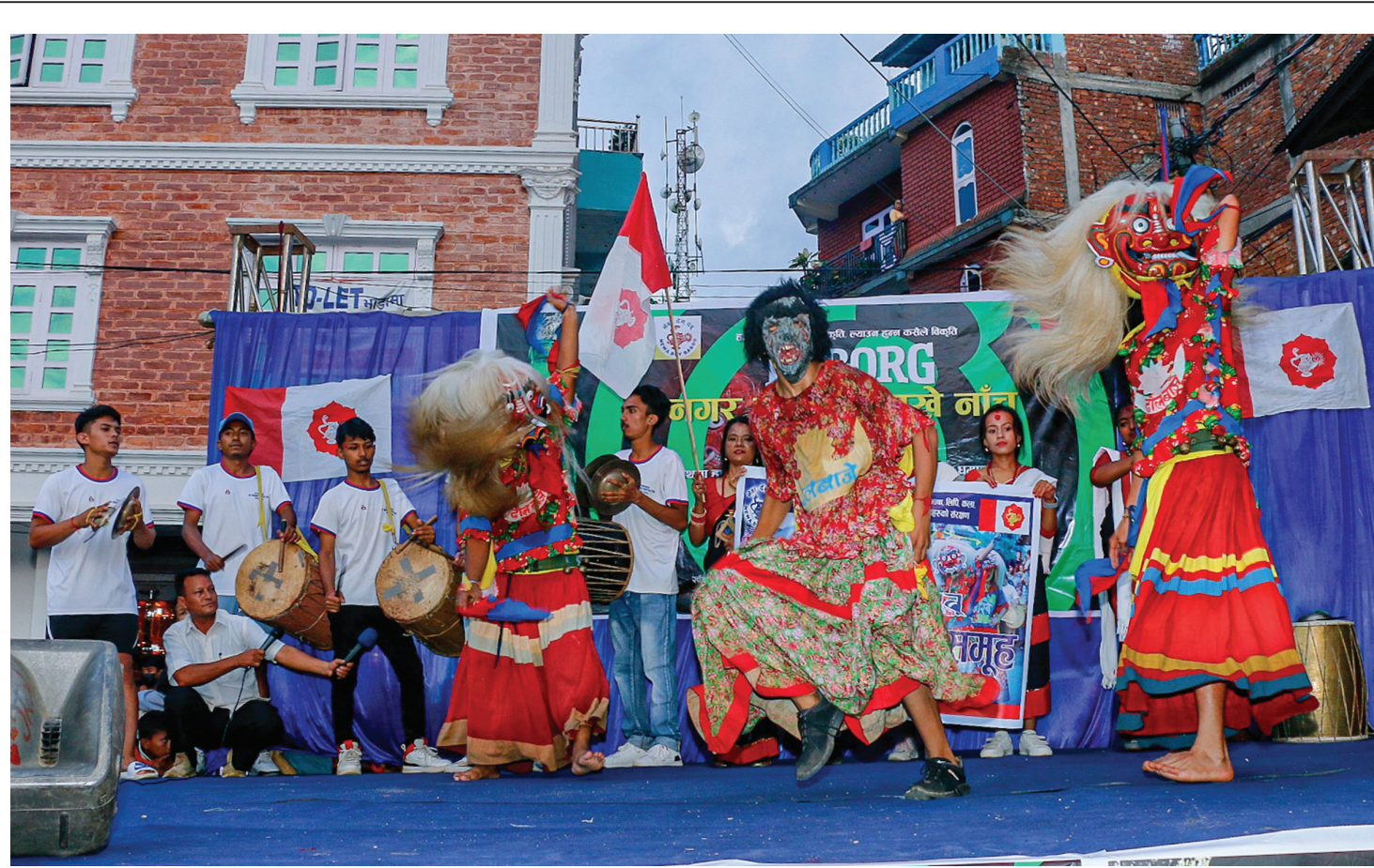
लाखे नाच | संखुवासभाको खाँदवारीमा संस्कृति संरक्षण गर्ने ध्येयले नेवारहरूको साभ्रा संस्था नेवा: देय दू: नगर कार्यसमितिले बिहीबार आयोजना गरेको लाखे नाच प्रतियोगिता गितामा प्रतियोगी लाखे ।