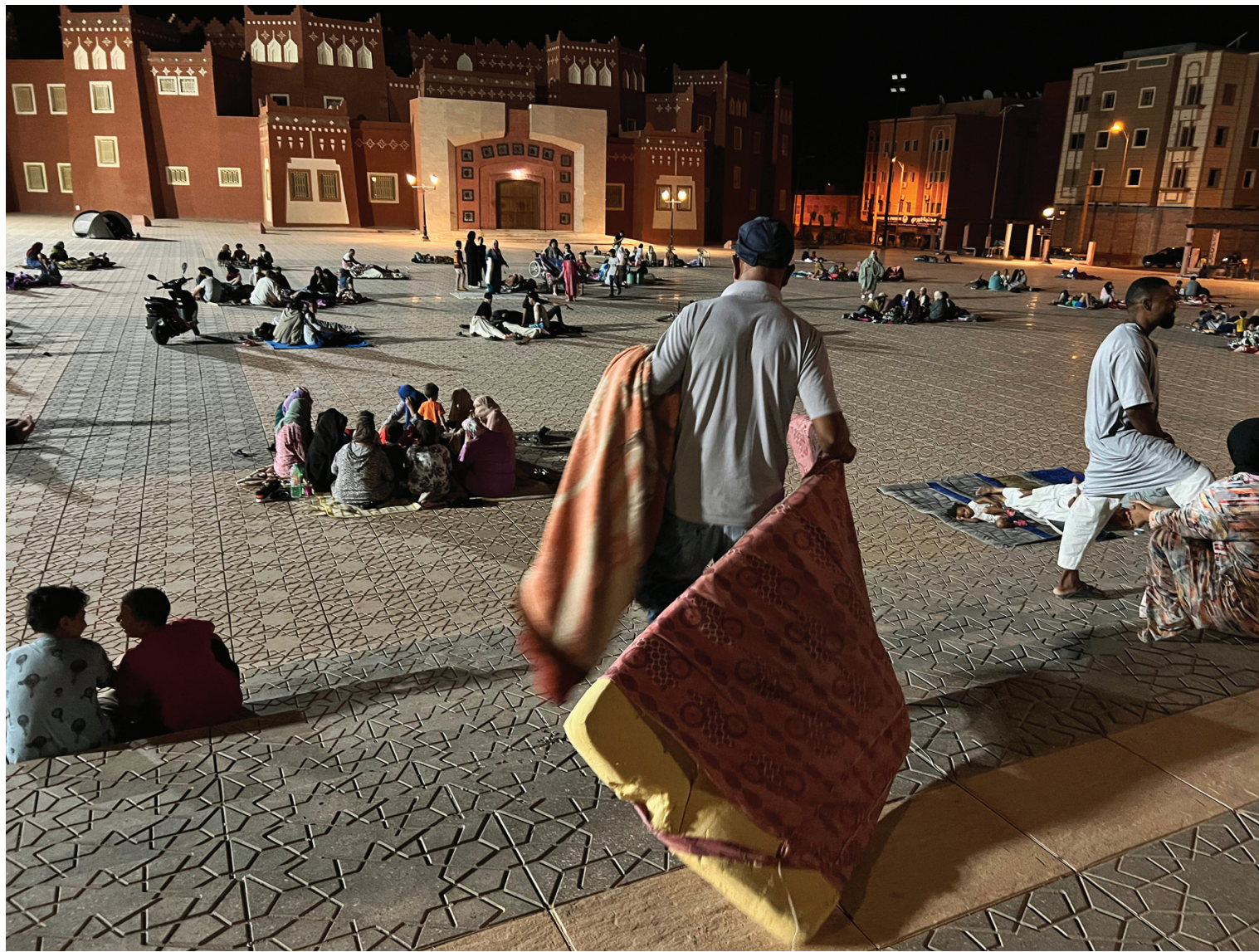
गृहमन्त्रालयको आचारसंहिताको अन्तर्गतमा भूकम्पपछि खुला ठाउँमा आश्रय लिइरहेका नागरिकहरू।