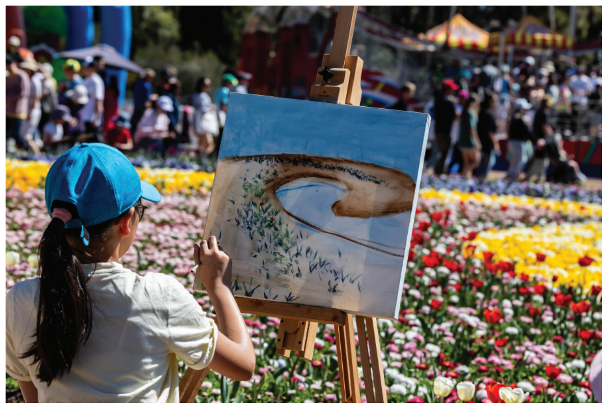
क्यानबेरा, अस्ट्रेलियाको कमनवेल्थ पार्कमा आयोजित पुष्प महोत्सवमा चित्र कोर्दै एक आगन्तुक।