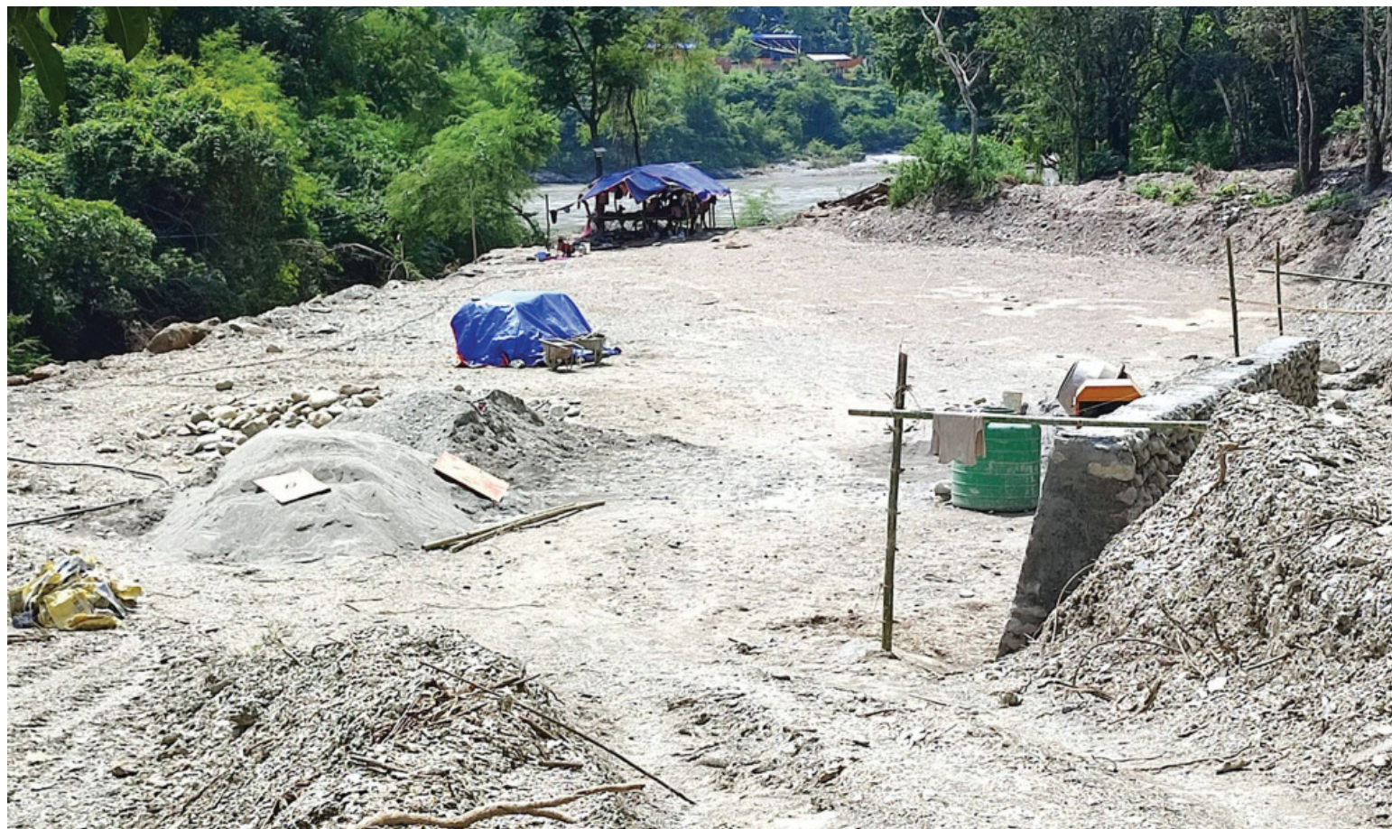
फोहोर व्यवस्थापनमा चुनौती

स्याङ्जाको गल्याङ नगरपालिका-३ छतिघाटमा नगरपालिकाले निर्माण गर्न लागेको फोहोर व्यवस्थापन केन्द्र । उच्च अदालत पोखराले छतिघाटमा फोहोर