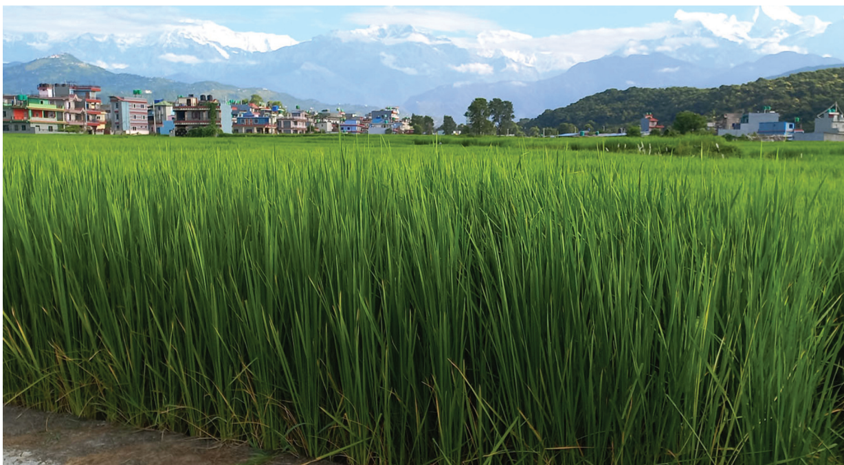
अब्बल कास्की जिल्लाको पोखरा-१७ विरवा फाँटमा लहलह भएको धानमध्येको अब्बल धान जेतोबुढो। जेतोबुढो धान