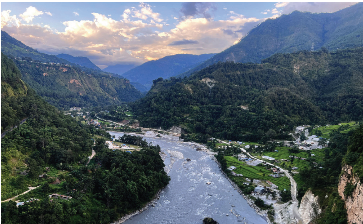
सलल कालीगण्डकी पानीको बहाव घटेपछि बागलुङ खण्डमा देखिएको कालीगण्डकी नदी। कालीगण्डकीको बागलुङ-पर्वत खण्डमा आन्तरिक पर्यटकलाई लक्षित गर्दै ज्याफिटिङ गराइने गरेको छ।