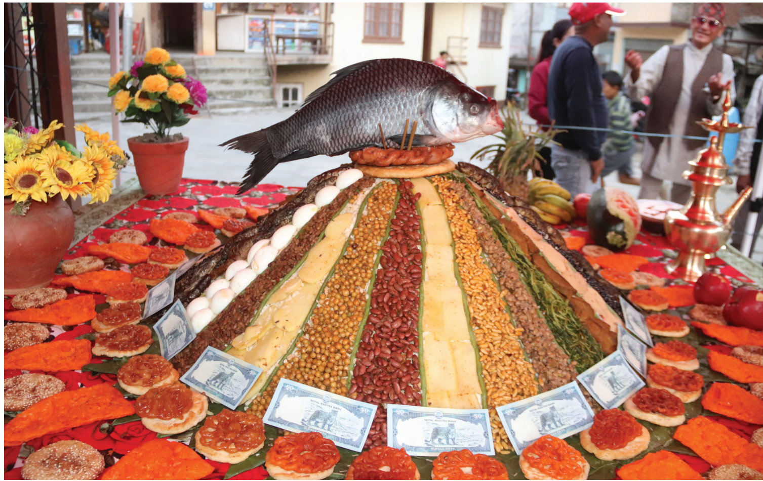
समयबजी | तारकेश्वर नगरपालिका-१० स्थित मनमैजुको नासलचोकमा नेवारी समुदायले विभिन्न परिकार मिसाएर बनाएको समयबजी ।