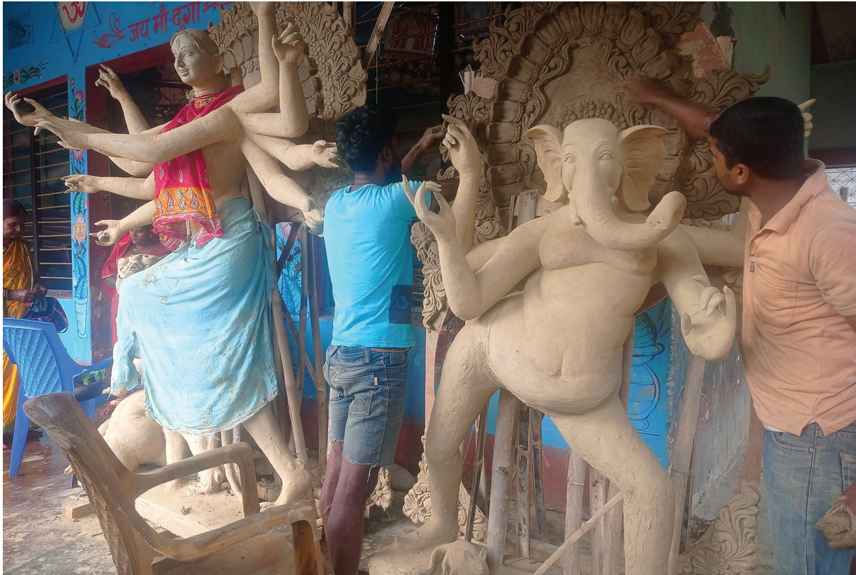
नवरात्री पूजाका लागि मूर्ति | सुनसरीको इनरूवा-२ स्थित दुर्गा मन्दिर परिसरमा नवरात्री पूजाका लागि दुर्गा र गणेश भगवानको मूर्ति निर्माण गर्दै कालिगढ ।