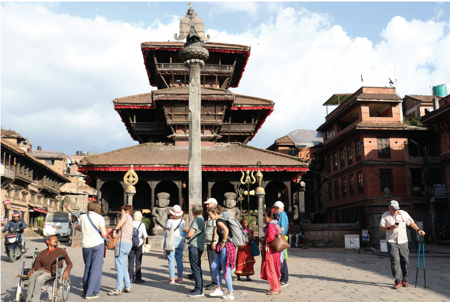
दत्तात्रय मन्दिरमा पर्यटक

भक्तपुरको प्रसिद्ध दत्तात्रय मन्दिर अवलोकन गर्दै विदेशी पर्यटक। ब्रम्हा, विष्णु र महेश्वरको स्वरूप त्रिशक्तिको रूपमा पुजिने यस मन्दिर प्यागोडा शैलीमा राजा यक्ष मल्लले बनाउन लगाएको मानिन्छ।