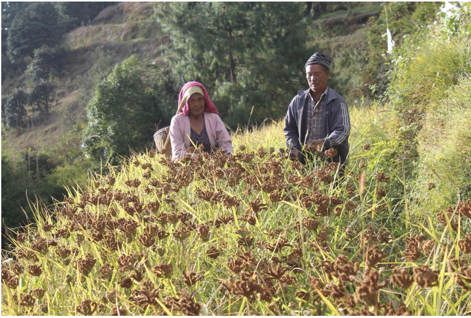
कोदो मित्रयाउँदै म्यादीको अन्नपूर्ण गाउँपालिका-८ राम्बेका किसान कोदो मित्रयाउँदै ।