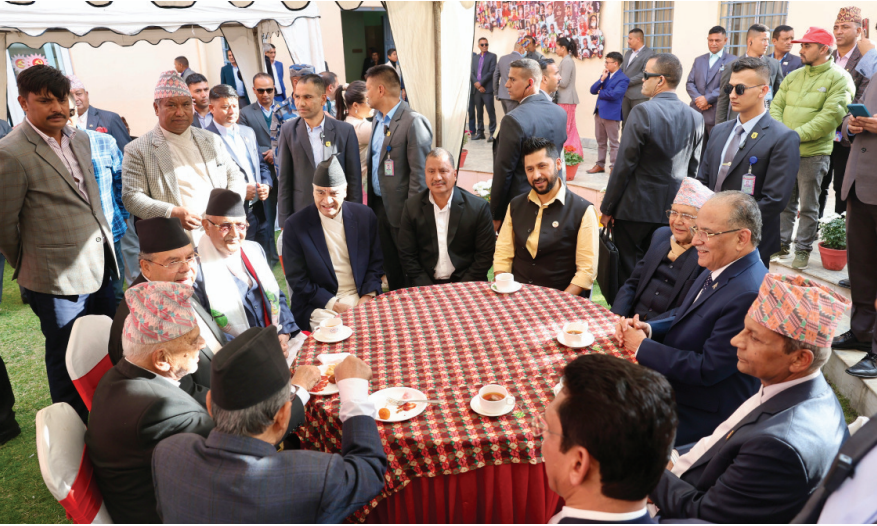
नेकपा एमालेले बडाबसैं, तिहार, नेपाल संवत् र छठ पर्वका अवसरमा बुधवार ललितपुरको च्यासलस्थित पार्टी कार्यालयमा आयोजना गरेको शुभकामना आदानप्रदान तथा चियापान कार्यक्रममा सहभागी नेताहरू ।