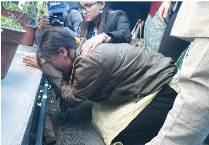
अदालतको आदेशपछि सैद सर्वोच्चको भुँईं ढोढै भारती शोर्पा ।

रिगललाई रिहा गर्ने प्रक्रियामा जोडिएका राष्ट्रपति र सरकारमाथि गम्भीर नैतिक प्रश्न उठेको छ