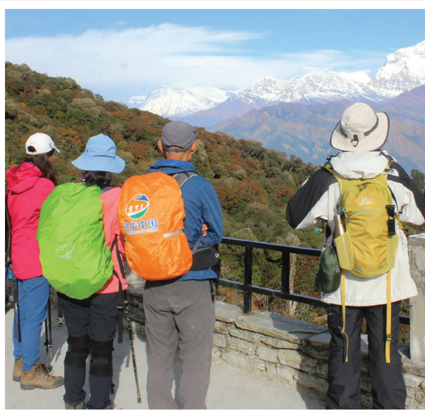
हिमाल हेर्दै पर्यटक म्याग्दीको अन्नपूर्ण गाउँपालिका-६ मा पर्ने घोडेपानीबाट धौलागिरि हिमाल अवलोकन गर्दै पर्यटक। घोडेपानीबाट धौलागिरि र अन्नपूर्ण रेञ्जका हिमशृङ्खलाको मनमोहक दृष्य अवलोकन गर्न सकिन्छ।