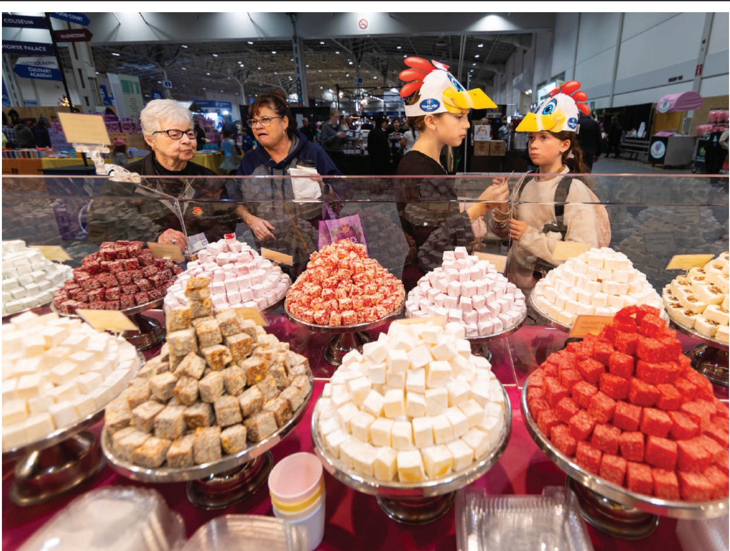
क्यानाडाको टोरन्टोमा आयोजित '२०२३ रोयल एग्रिकल्चरल विन्टर फेयर' मेलाका खानाको स्वाद लिइरहेका मानिसहरू।