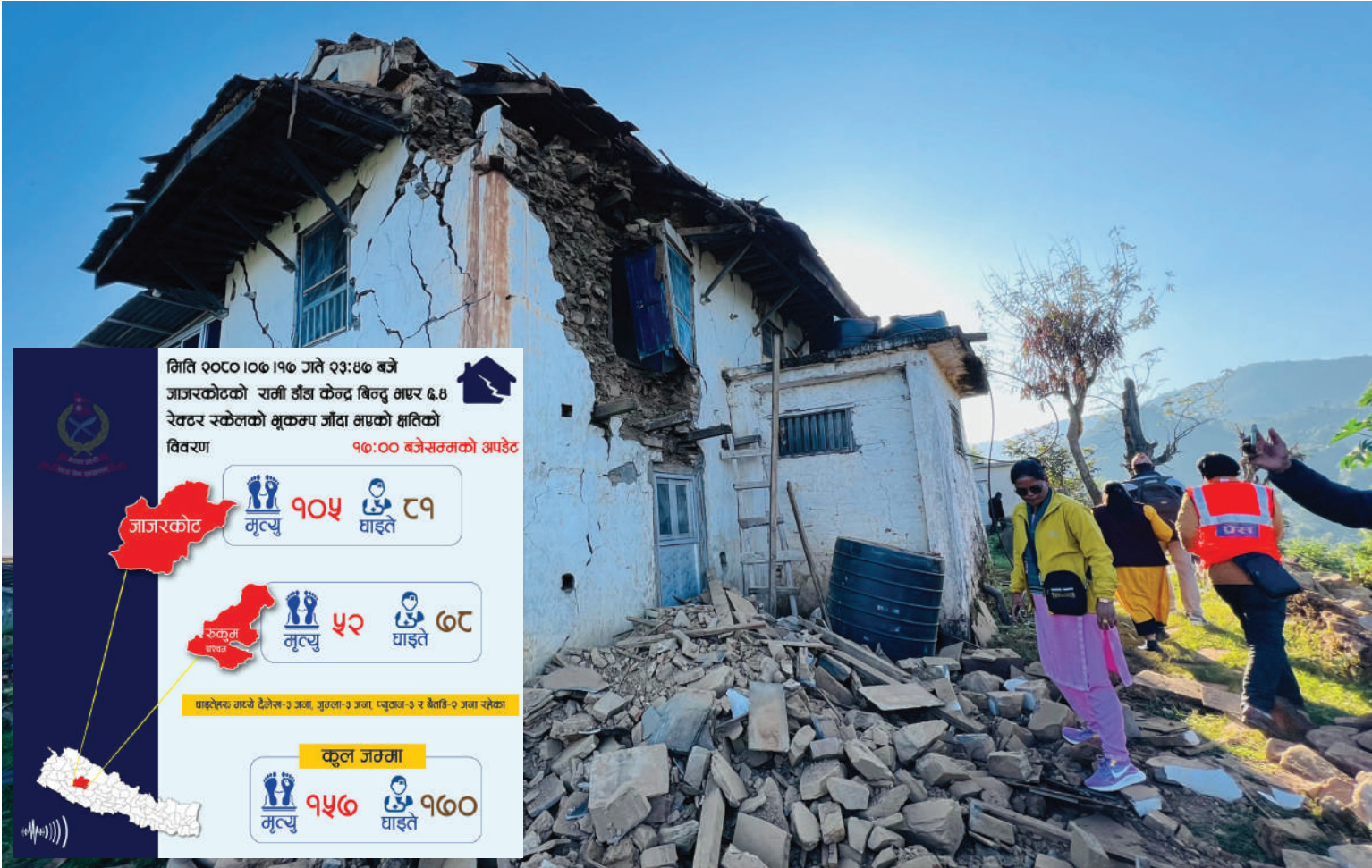
इन्फोग्राफिक्स: नेपाल प्रहरी

◆ मृतकमध्ये १०५ जना जाजरकोट र ५२ जना रुकुम पश्चिमका