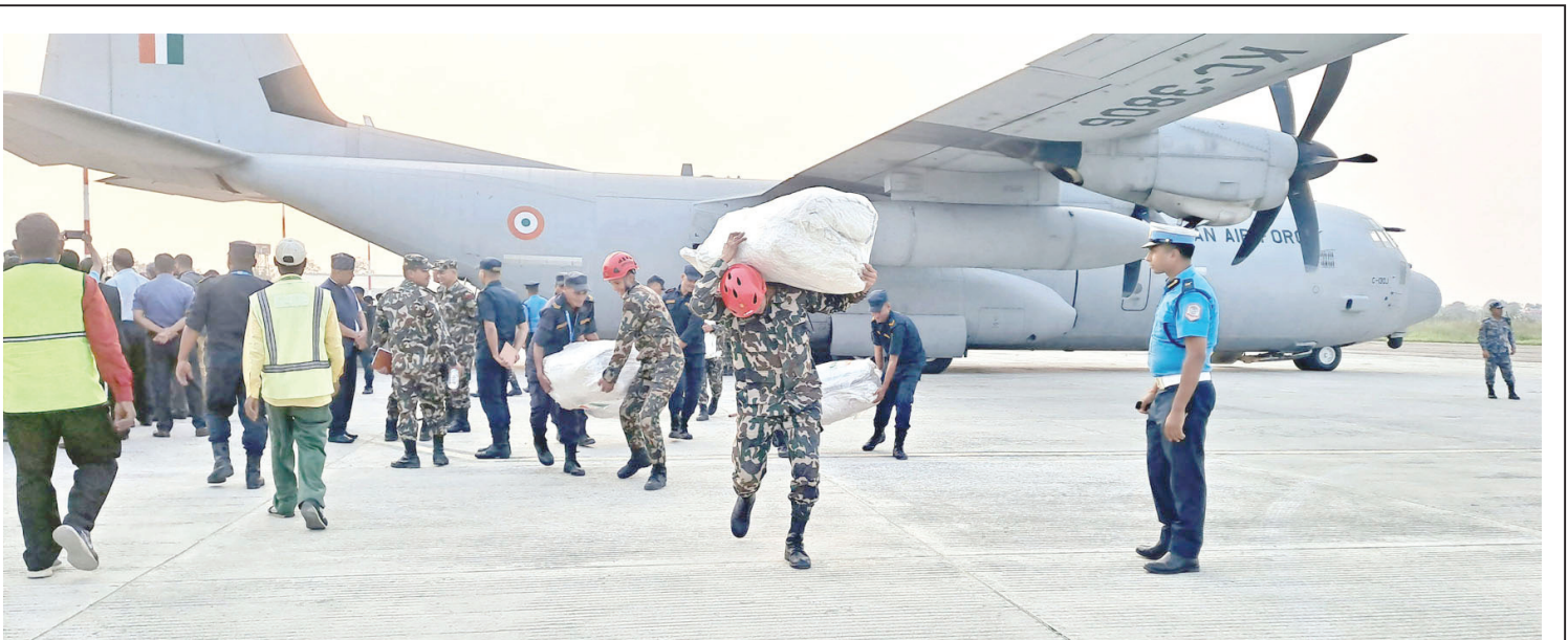
राहत सामग्री भारत सरकारले जाजरकोट र रुकुम पश्चिमका भूकम्पपीडितलाई हस्तांतरण गरेको राहत सामग्री नेपालगञ्ज विमानस्थलमा भारतीय वायुसेनाको विमानबाट ओसाउँ राखिने।