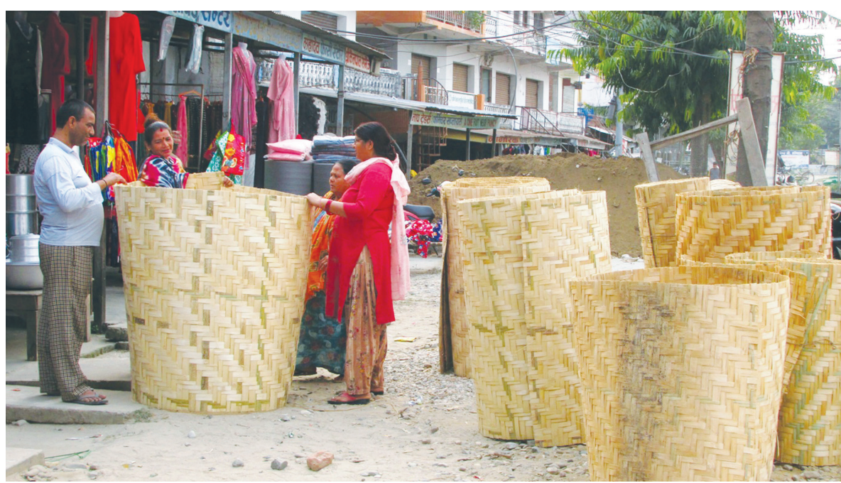
बाँसको अकारी | कञ्चनपुरको शुक्लाफाँटा नगरपालिका-१० फलारी बजारमा बिक्रीका लागि राखिएका बाँसबाट निर्मित भकारी।