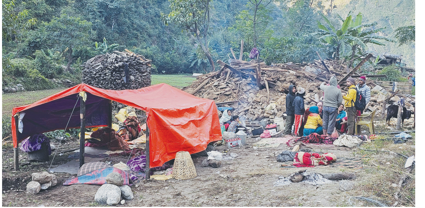
रुकुम पश्चिमको आठबिसकोट नगरपालिका-१४ क्षपारेमा भूकम्पले घर भत्काएपछि त्रिपालमुनि बसेका स्थानीय।