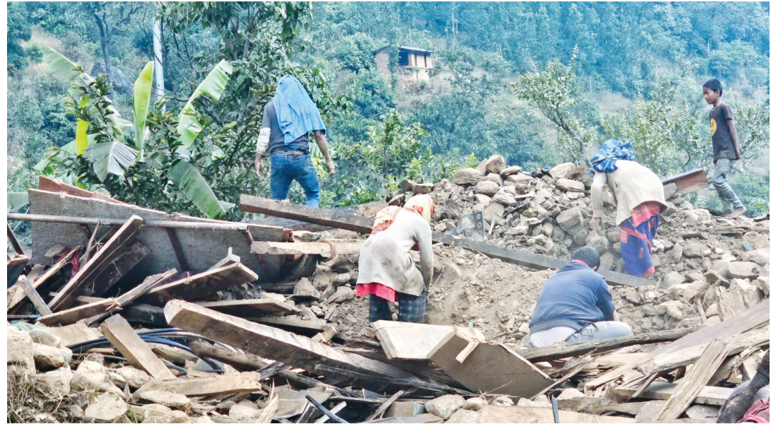
रुकुमपश्चिमको आठविसकोट नगरपालिका-१४ क्षपारमा भूकम्पले भत्किएको घर उत्खनन् गरेर पुर्नएका सामग्री निकाल्दै स्थानीयवासी ।

भूकम्पका कारण मानवीय क्षति भने जाजरकोटमा सबैभन्दा धेरै भएको छ । जाजरकोटमा भूकम्पमा परी सोमबार साँफसम्म १०५ जनाको मृत्यु भएको छ भने यहाँका १३३ घाइते विभिन्न अस्पतालमा उपचाररत छन् । यता रुकुम