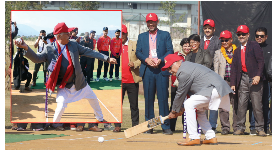
पोखरामा केपी ओली कप क्रिकेट प्रतियोगिता उद्घाटन गर्दै एमाले अध्यक्ष केपी शर्मा ओली ।