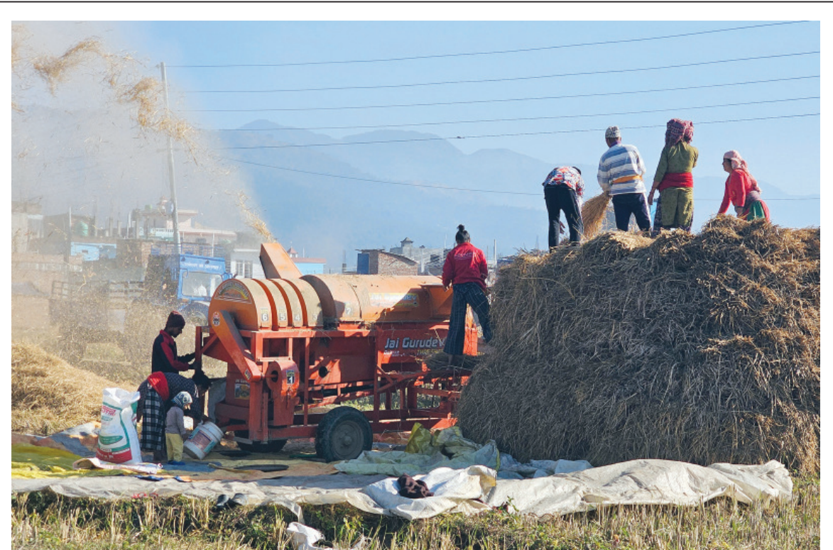
मंसिरै मान्छे | सुर्खेतको वीरेन्द्रनगर नगरपालिका ४ मंसुरिखेतमा श्रेसरको सहायताले धान भाँदै किसान।