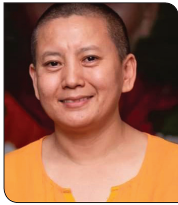
» आनी छोइड डोल्मा

मानिसको धर्म नै मानवता हो। मानिसमा हनुपनै मानवीय गुणको विकास र पूर्णतालाई नै मानव धर्म भनिन्छ। धर्म भनेको सम्पूर्ण प्राणीको कल्याण गर्नु हो। मानव सेवाबाट नै धर्म प्राप्तको ढोका खुल्दछ। सेवा यति नै गर्नुपर्छ भन्ने छैन, इमान्दारी र खुसीपूर्वक गरिने पुण्य जति पनि कार्य छन्, ती सबै धर्म हुन्। सेवा भनेको जति सकिन्छ, त्यति गर्ने हो, मात्र पवित्र आशय राख्नुपर्छ। सामाजिक सेवा आफ्नो धर्म हो। सामाजिक सेवा गर्नु भनेको एउटा मानवीय धर्म हो, जसमा विशेष गरेर आफू बुद्धको अनुयायी भएपछि जीवन सार्थक बनाउने आफ्नो प्रयास हो। धेरै गरे वा थोरै गरे भन्ने हिसावकतावमा लाग्ने होइन, आफूले जति सकिन्छ, त्यति गर्ने हो। बुद्ध धर्ममा लागेको र बुद्धका अनुयायी भएर एउटा सत्कर्मको वाटोमा लागेर आफूले पाएको संगीतको माध्यमबाट जसरी आफूलाई र अरूलाई खुसी दिन सकेको छु त्यसैमा आफू रमाइरहेको छु र यसबाट नै जीवनको सार्थकता पुष्टि हुन्छ भन्ने लाग्दछ।