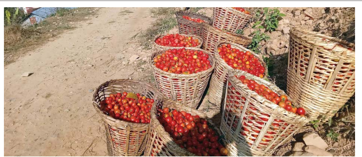
बजार लैजाँ | सिन्धुपाल्चोकको चौतारा साँगाचोकगढी नगरपालिका-१४ डडुवाका कृषकले उत्पादन गरेको गोलभेंडा डोकामा हालेर बिक्रीका तयारीमा लागि बजार लाने तयारीमा।