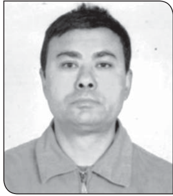
► पदम श्रेष्ठ