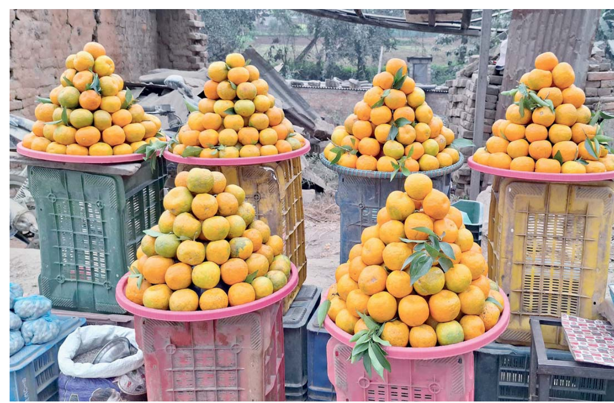
बिक्रीका लागि | तम्हुँको आँबुबैरेनी गाउँपालिका-३ स्थित मुख्य बजारको सडकछेउमा बिक्री गर्न राखिएका सुन्तला। राजमार्ग भएर यात्रा गर्ने सुन्तला यात्रुलाई लक्षित गरी व्यापारीले सडक छेउमा सुन्तला बिक्री गर्न राखेको हो।