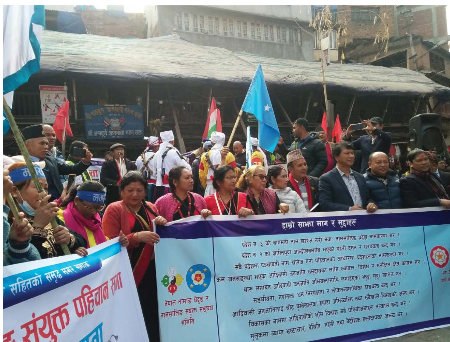
पहिचानको खोजी बागमती प्रदेशलाई 'नेवा-तामालिङ' नामकन गर्न माग गर्दै शनिवार राजधानीमा नेवार र तामाङ समुदायले गरेको संयुक्त प्रदर्शन। प्रदर्शनमा अन्य जातीय संगठनहरूले पनि साथ दिएका थिए।