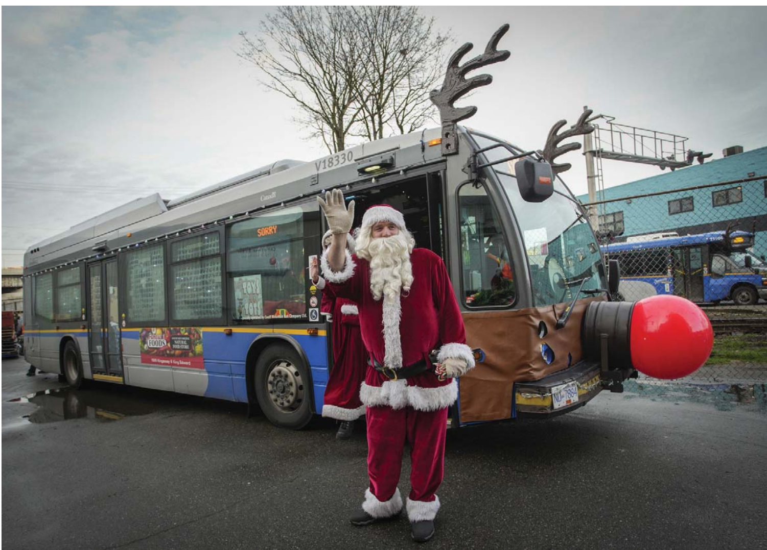
क्यानाडाको ब्रिटिश कोलम्बियाको भ्यानकुभरमा 'टोइज फर टोटस' कार्यक्रमको क्रममा सजाइएको बस अगाडि सान्ता क्लजको पोसाक लगाएर स्वागत गर्दै बसका कर्मचारी।