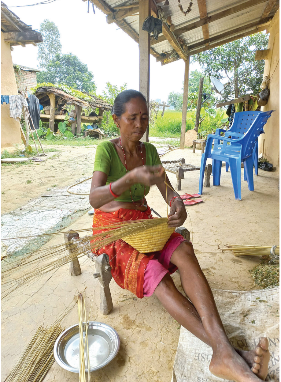
ढकिया बुन्दे : फुसुदको बेला परम्परागत सिपको प्रयोग गरी ढकिया बुन्दै कैलालीको गौरीगङ्गा नगरपालिका-८ की थारु महिला।

४०.१२, उत्पादन १५८.९८, अन्य ३.६, लघुवित्त ५६.८२ र लगानी २.६८ बिन्दुले बढेको छ। कारोबारका आधारमा सोमबार नेशनल हाइड्रोपावर शीर्ष स्थानमा रहेको छ। सो कम्पनीको रु ७४ करोड ९७ हजार ४५६ बराबरको कारोबार भयो। नेपाल बैंक रु ६४ करोड ७० लाख २४ हजार ३२१, एचआइडिसिएल रु ५४ करोड ८४ लाख ७४ हजार ७९६, डाडी ग्रुप अफ पावर रु ४८ करोड ४८ लाख ८६ हजार ६४८, अपि पावर कम्पनी रु ४७ करोड ९७ लाख ३१ हजार ५९४ बराबरको कारोबार भई शीर्ष स्थानमा रहे। नेप्से फिनो अंकले बढे पनि विभिन्न पाँच कम्पनीको शेयरमा सकारात्मक सर्किट लागेको छ। नेशनल हाइड्रोपावर, कर्पोरेट डेभलपमेन्ट बैंक, रिडी हाइड्रोपावर, खानीखोला हाइड्रोपावर, जीवन विकास लघुवित्तको शेयरमा १० प्रतिशतको बृद्धि भयो। यस्तै, आईएसएफसी फाइनान्स ६.२७, माउण्टेन इनर्जी नेपाल ५.३३, युनियन लाइफ इन्स्युरेन्स ४.५३, डाडी ग्रुप अफ पावर ४.३२ र नेपाल एसबिआई बैंकका लगानीकर्ताले ३.४१ प्रतिशतले गुमाए।