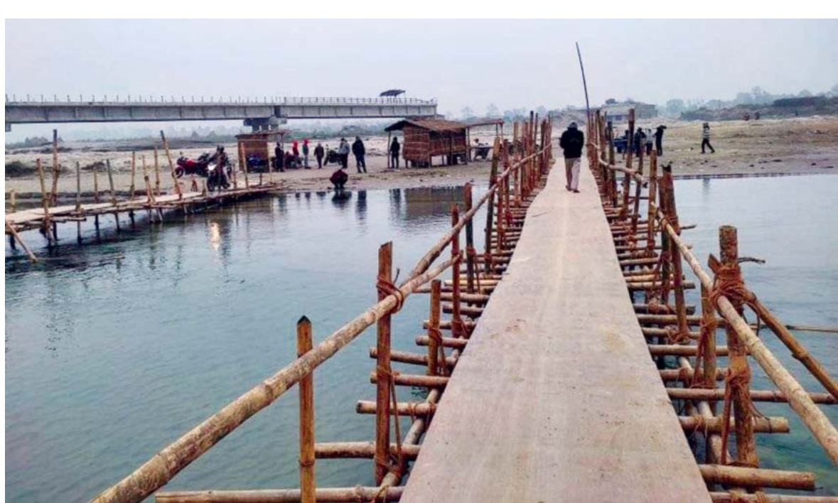
अलपत्र पुल | हुलाकी सडक खण्डअन्तर्गत पर्ने सिरहा-धनुषा जोडिने कमला पुल। पुल बन्न सुरु भएको १३ वर्ष भए पनि हालसम्म पुल बन्न सकेन।