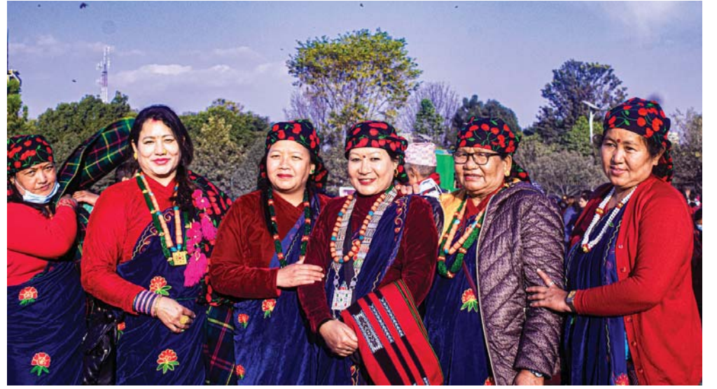
तमू ल्होसारको रौनक | तमू ल्होसारको अवसरमा काठमाडौंको टुँडिखेलमा आयोजित तमू ल्होसार महोत्सवमा मौलिक भेषभूषाका साथ सहभागीहरू।