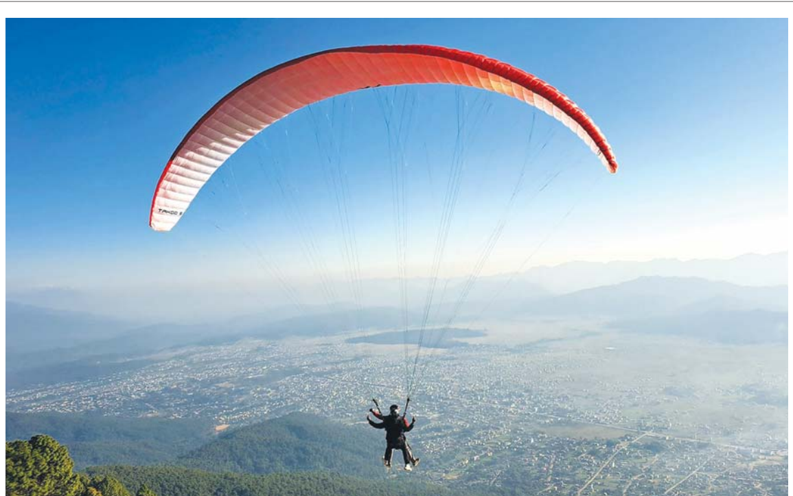
प्याराग्लाइडिङमा सुर्खेतको वीरेन्द्रनगर-१४ गढीबाट प्याराग्लाइडिङ गर्दै आन्तरिक पर्यटकहरू। वीरेन्द्रनगरको अवलोकन गर्नेगरी केही मस्त पर्यटक समग्रअधिवेष्टि व्यावसायिक प्याराग्लाइडिङ सुरु गरिएको छ।