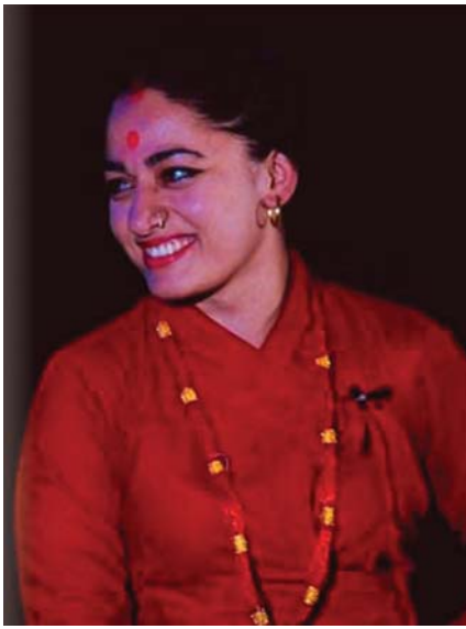
अहंकार, मोह, विच्छेद र डरका विशेषतालाई समेटेर नाटक लेखिएको छ । यसअघि यो नाटक नेपालमा २०७६ मा मञ्चन भएको थियो ।

कार्कीको निर्देशन र प्रतीक्षा कट्टेल लिखित यो नाटकले रामायणकालीन कथालाई वर्तमान समयमा ढालेर पेश गर्छ । हिन्दु धर्मशास्त्रमा वर्णित अज्ञानता,