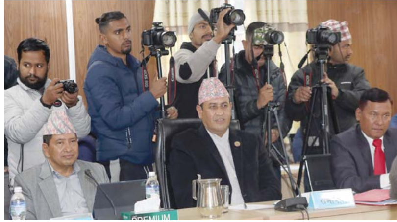
सोमबार संसद्को राज्य व्यवस्था तथा सुशासन समितिको बैठकमा गृहमन्त्री नारायणकाजी श्रेष्ठ।

प्रहरी महानिरीक्षक कुँवरले पनि समितिको बैठकमा जवाफ दिँदै मन्त्री ज्वालालाई नै दोष लगाएका छन्। उनले भने, '११:५२ मा मन्त्रीज्यू आउनुभयो। उहाँ पार्टी प्यालेसबाट कोटेश्वरतर्फ जाँदै गरेको अवस्था थियो। त्यही