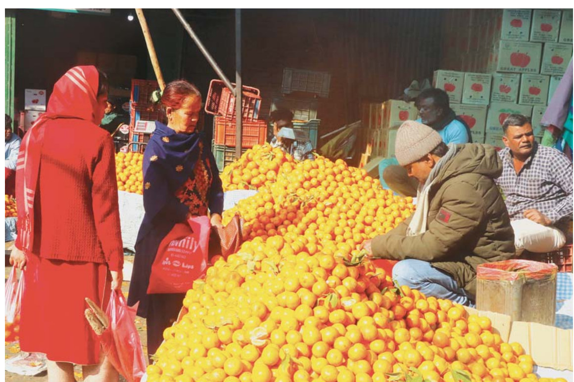
बिक्रीमा कालीमाटी फलफूल तथा तरकारी बजारमा व्यापारीले बिक्रीका लागि राखेको सुन्तला।