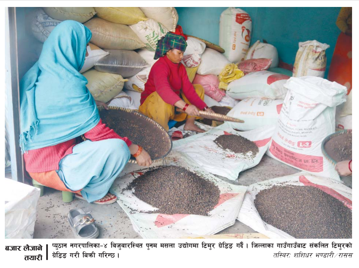
बजार लैजाणे तयारी | प्युठान नगरपालिका-४ विजुवारस्थित पुनम मसला उद्योगमा टिमुर ग्रेडिङ गर्दै। जिल्लाका गाउँगाउँबाट संकलित टिमुरको ग्रेडिङ गरी बिक्री गरिन्छ।