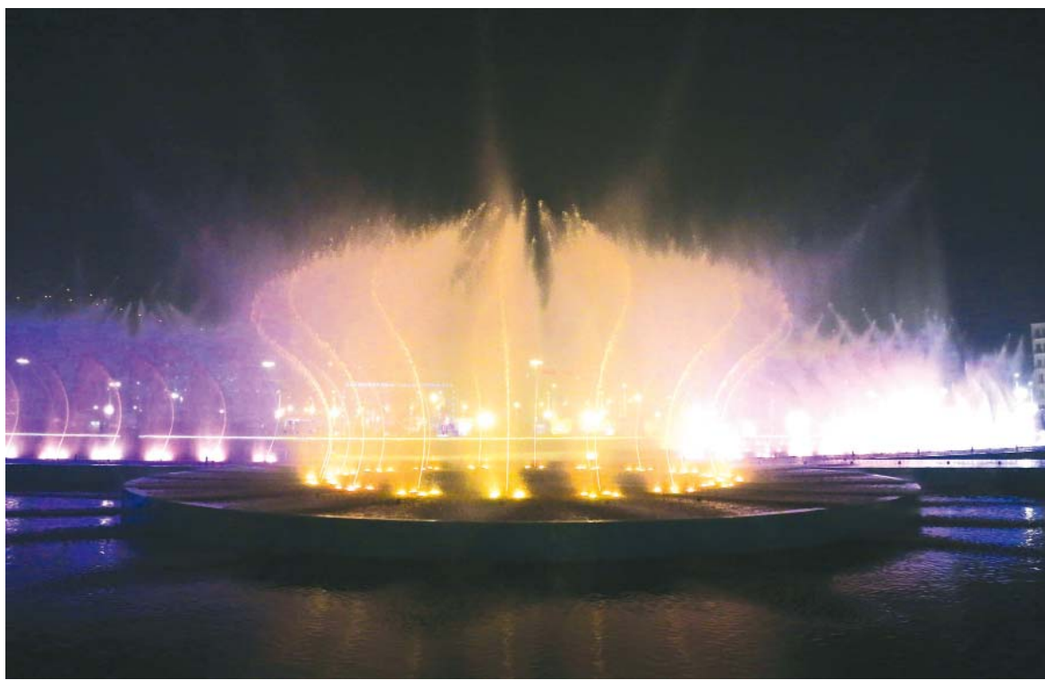
पाकिस्तानको राजधानी इस्लामाबादमा शुक्रवार प्रदर्शन गरिएको 'म्युजिकल फाउण्टेन' को एक दृश्य।