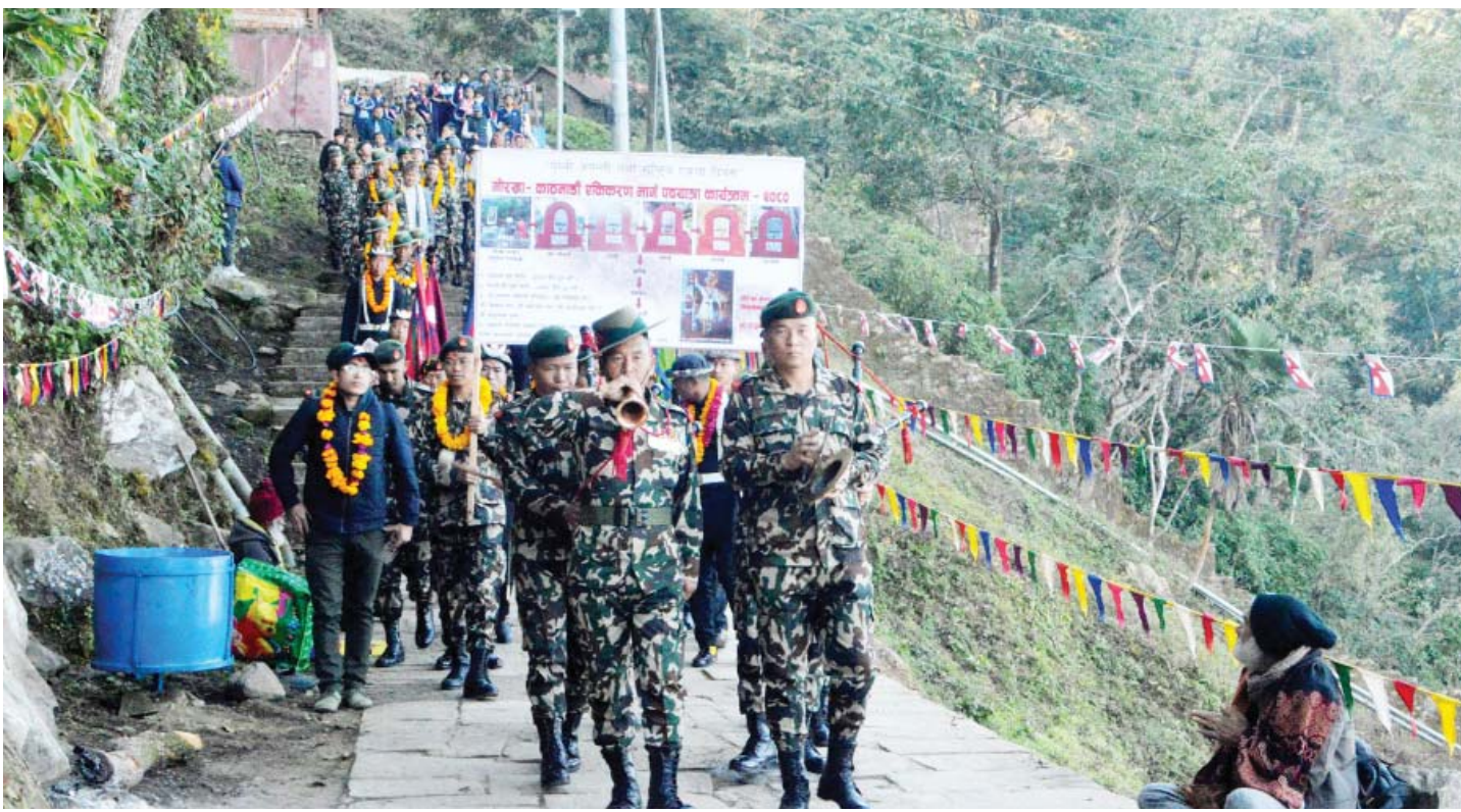
एकीकरण पदयात्रा | गोरखा दरबारबाट शनिवार एकीकरण पदयात्रामा निस्किएको नेपाली सेनाको टोली। सो टोली धादिङ-नुवाकोट हुँदै पुस २६ गते काठमाडौं पुग्ने छ।