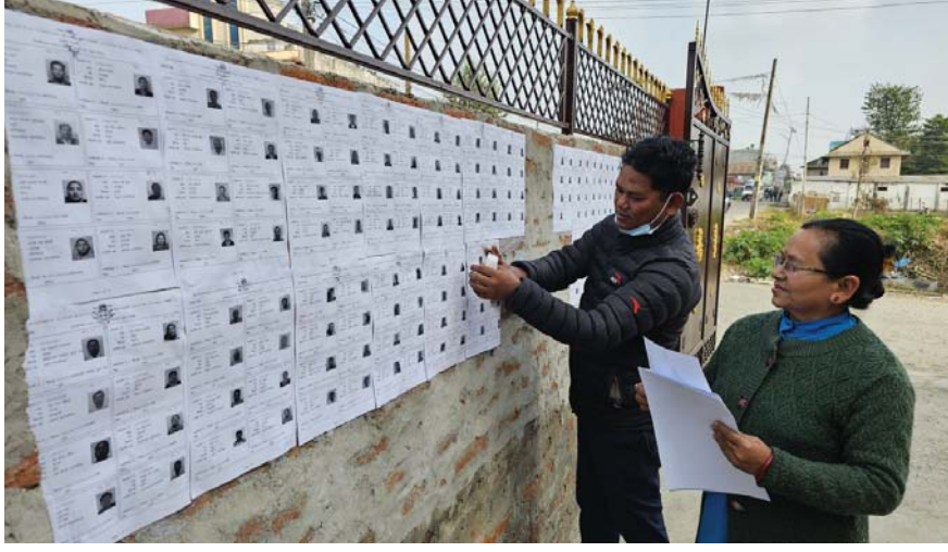
प्रदेश निर्वाचन कार्यालय लुम्बिनी प्रदेशले आइतबार राष्ट्रिय सभा निर्वाचनको अन्तिम मतदाता नामवली प्रकाशन गर्दै।

वर्ष १० अंक २४९ काठमाडौं सोमबार, २३ पुस २०८० Prabhav National Daily Monday, January 8, 2024 www.prabhavonline.com पृष्ठ ८ मूल्य रु. ५१-