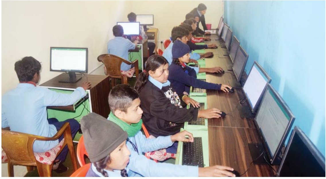
प्रविधिमेत्री शिक्षा | म्याग्दीको बेनी नगरपालिका-४ डाँडाखेतमा रहेको बालमन्दिर आधारभूत विद्यालयका विद्यार्थीहरू कम्प्युटर विषयको प्रयोगात्मक अध्ययन गर्दै ।