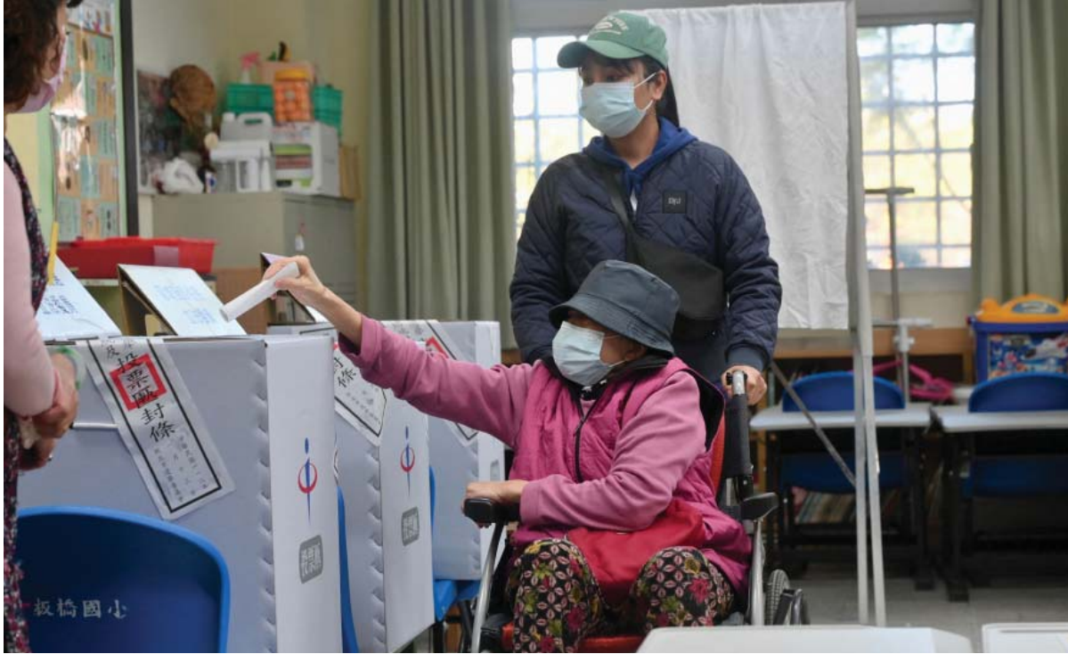
ताइवानमा शनिवार सम्पन्न राष्ट्रपतीय चुनावमा न्यु ताइपेई सहरस्थित एक प्राथमिक विद्यालयको मतदान केन्द्रमा मतदान गर्दै एक महिला।