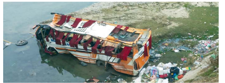
शुक्रबार राति दाङको राप्ती नदीमा खसेको बस।

दाङको राप्ती नदीमा बस खस्दा १२ जना, काठमाडौंको चन्द्रागिरिस्थित सेतोपहरामा गाडी खस्दा पाँच जना र बागलुङ जिल्ला दुर्घटनामा दुई जनाको मृत्यु