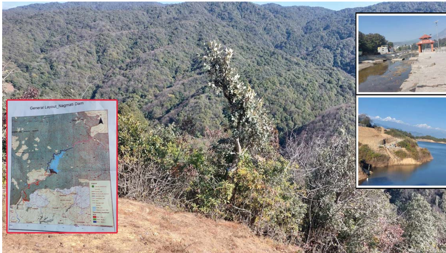
गोकर्णेश्वर नगरपालिकास्थित-१ स्थित शिवपुरी नागार्जुन राष्ट्रिय निकुञ्जमा निर्माण हुने नागमती ड्याम निर्माणस्थल ।