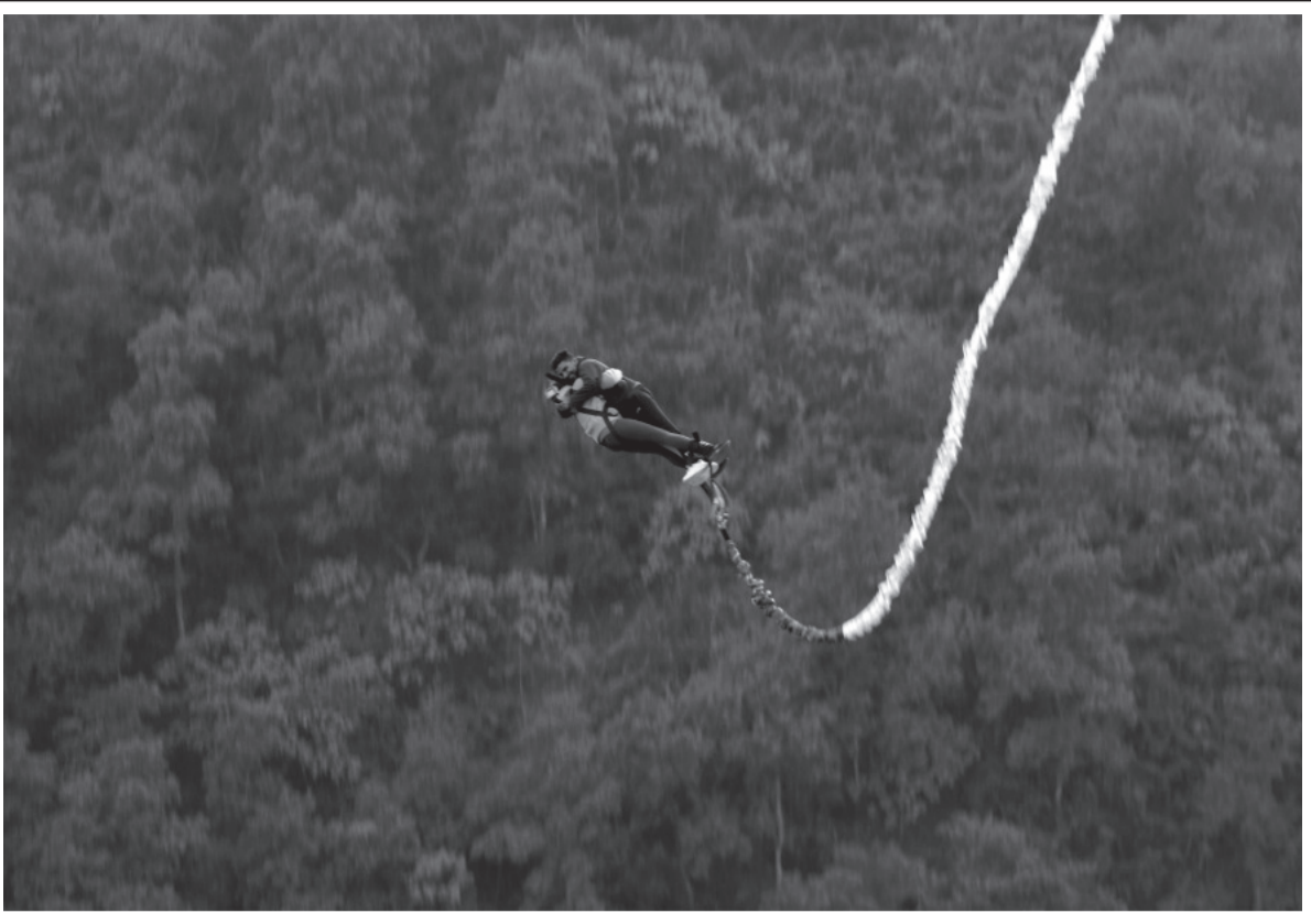
बन्जीजम्पमा पोखरा महानगरपालिका-२५ हेम्जाभा हाइग्राउन्ड एड्भेन्चर्स नेपाल प्रा.लि.ले सञ्चालन गरेको बन्जी जम्पमा रमाउँदै आन्तरिक रमाउँदै पर्यटक।