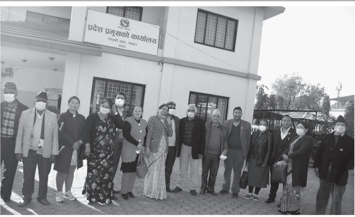
प्रदेशसभा सदस्यहरू गण्डकी प्रदेशसभाको विशेष अधिवेशन बोलाउन मंगलबार प्रदेशप्रमुखको कार्यालयमा पुगेका प्रमुख प्रतिपक्ष नेपाली कांग्रेस र जनता समाजवादी पार्टीका प्रदेशसभा सदस्यहरू।