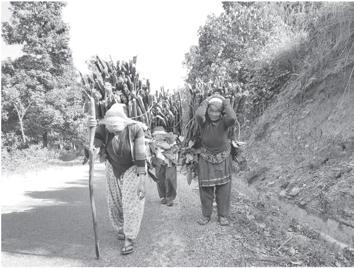
दाउरा बोकेर जन्तव्यतर्फ पोखरा-१८ सराङकोटका महिला वनवाट दाउरा बोकेर गन्तव्यतर्फ जाँदै ।