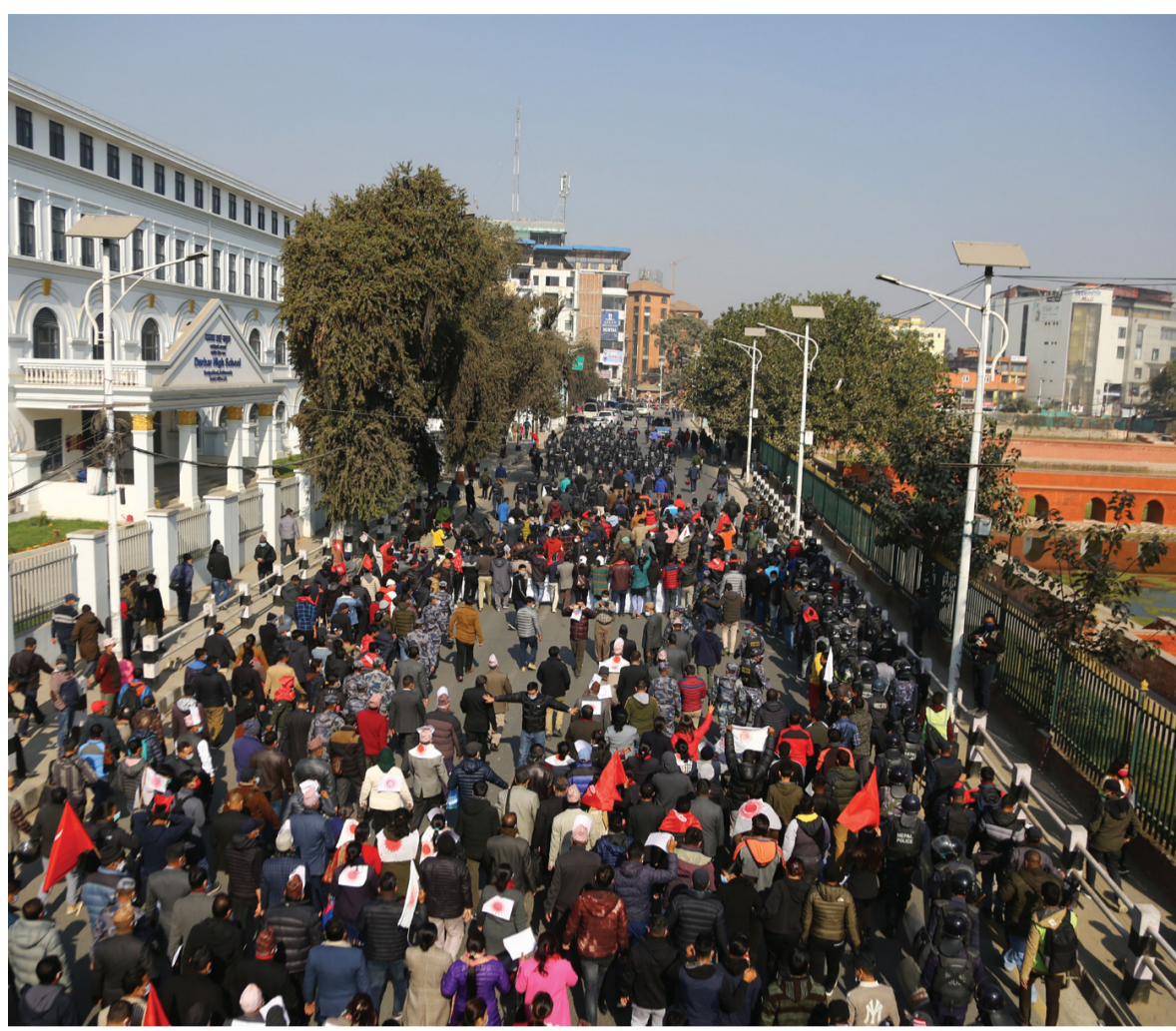
आधिकारिता र चुनाव चिह्न दावी नेपाल कम्युनिस्ट पार्टी (नेकपा) दाहाल, नेपाल समूहले शुक्रबार निर्वाचन आयोगसमक्ष पार्टीको आधिकारिता र चुनाव चिह्न दावीका लागि आयोगतर्फ जाँदै नेता तथा कार्यकर्ताहरू।