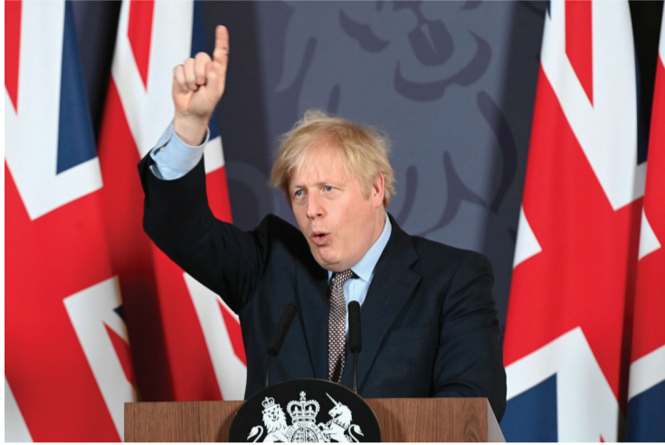
पाएकी छु ।

ब्रसेल्स (रासस-एएफपी)- बेलायत र युरोपेली युनियनबीच विहीवार नयाँ व्यापार सम्झौतामा हस्ताक्षर भएको छ। युरोपेली युनियनबाट बेलायतको बहिर्गमन (ब्रेकिंग) का सन्दर्भमा बेलायत र युरोपेली युनियन (इयु)बीच दश महिनादेखि जारी वार्ता सहमतिमा टुंगिएको हो। नयाँ वर्षको आगमनसँगै बेलायत औपचारिक रूपमा इयुबाट अलग हुनेछ। भन्दा आधा शताब्दीदेखि इयुमा आवद्ध बेलायतले पछिल्लो सम्झौता बमोजिम इयुबाट अलग भएसँगै इयुसँगको व्यापारमा करका प्राधान्यहरू सामना गर्नु पर्नेछ।