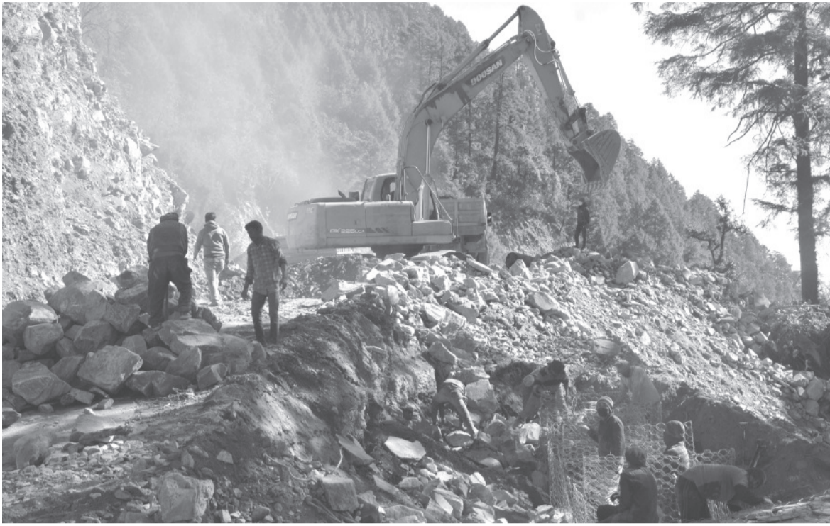
सालभण्डौरी-दोरपाटन सडक आयोजना

रूपन्देहीको सालभण्डौरीदेखि बागलुङको दोरपाटन जोड्ने राष्ट्रिय प्रार्थमिकताको आयोजनाअन्तर्गत दोरपाटन नगरपालिका-९, मा सडक स्तरोन्नतिको काम गरिँदै।