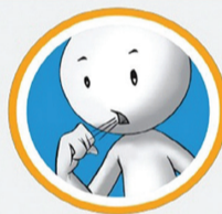
रुघा र खोकी

"नोवेल कोरोना भाइरस प्रभावित देशहरूबाट आउने मानिसहरूमा दुई हप्ता भित्र रुघाखोकी लागेमा, ज्वरो आएमा, घाँटी/टाउको दुखेमा, श्वासप्रश्वासमा अत्याधिक समस्या भएमा तुरुन्त नजिकको स्वास्थ्य संस्थामा सम्पर्क गर्ने।"