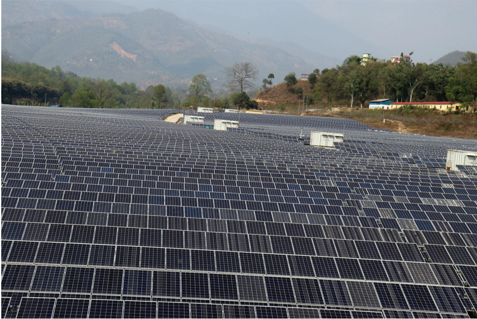
नुवाकोटको ग्रिड सोलार आयोजना : नुवाकोटमा निर्माणाधीन २५ मेगावाट क्षमताको मुलुककै ठूलो ग्रिड सोलार आयोजनाअन्तर्गत 'स्टाफ क्वार्टर ब्लक' क्षेत्रमा राखिएको सौर्य प्यानल यस आयोजना मार्फत हाल १० मेगावाट विद्युत् उत्पादन गरेर केन्द्रीय प्रसारण प्रणालीमा जोडिएको छ, भने बाँकी काम छ महिनाभित्र सम्पन्न गर्ने लक्ष्य छ।