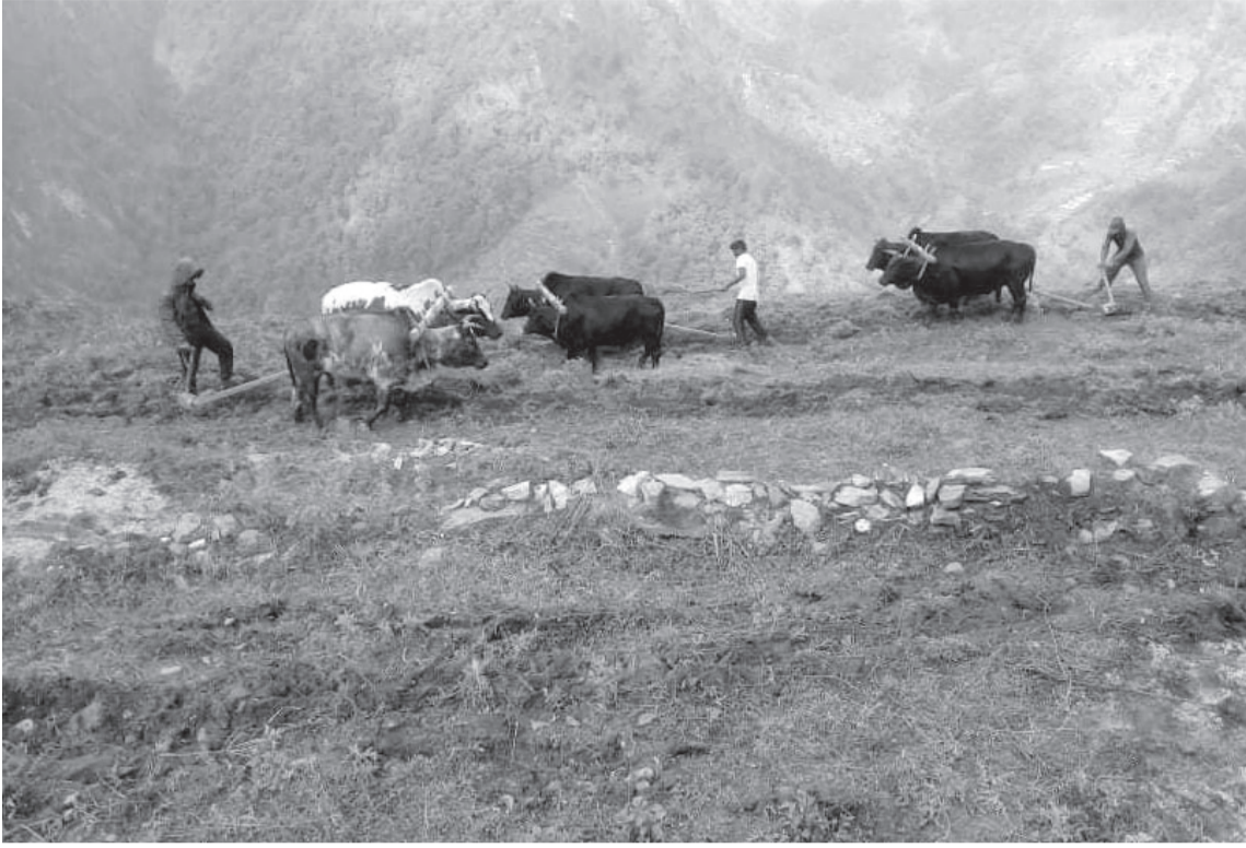
बाँफो जमीनमा खेती अभियान | म्याग्दीको मालिका गाउँपालिका-६ दुधुमा बाँफो जमीनमा खेती गर्नका लागि हलो जोत्दै । गाउँपालिकाले एक घर एक आत्मनिर्भर भन्ने नाराका साथ बाँफो जमीनमा खेती गर्ने अभियान शुरु गरेको छ ।