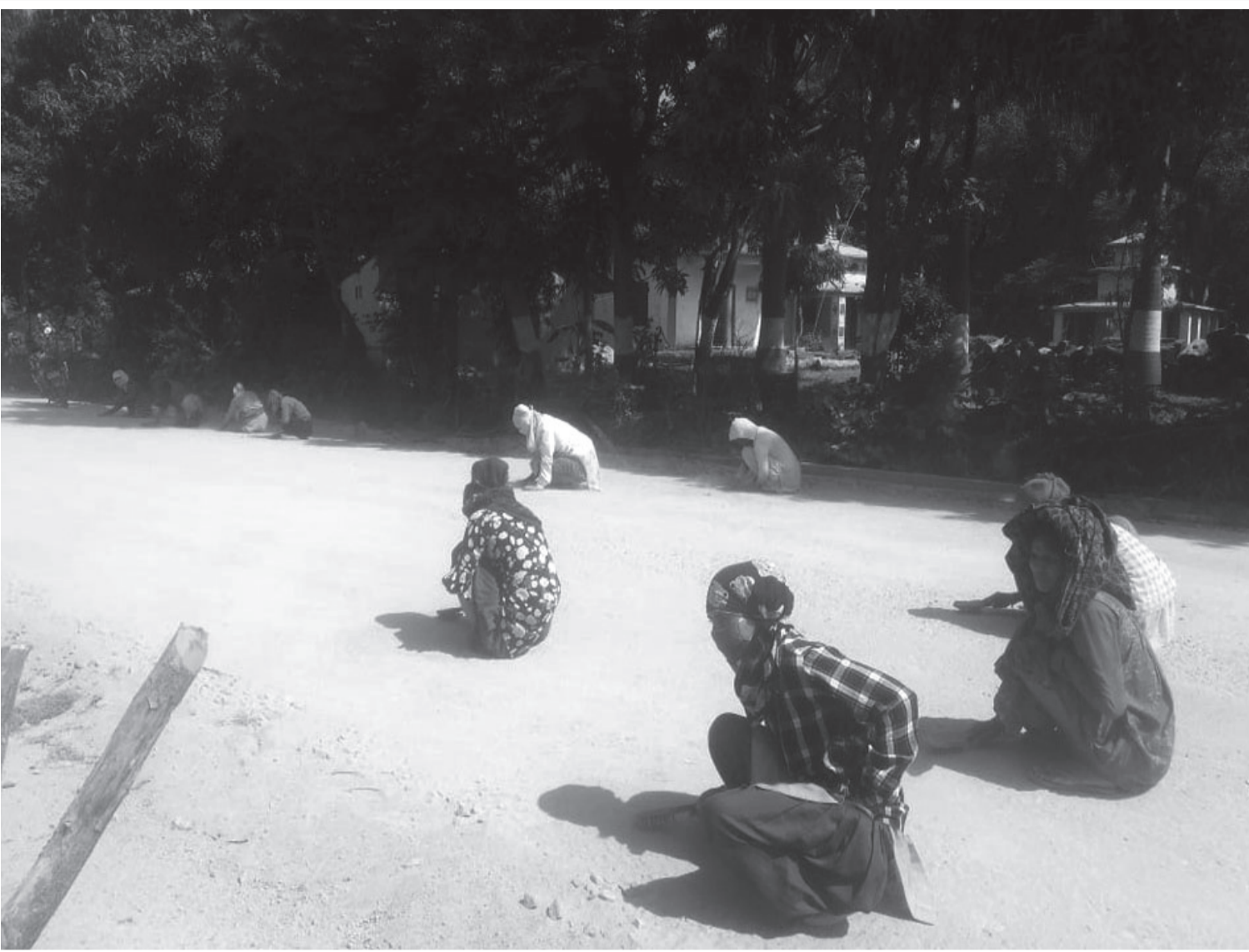
सडक सफाइमा कैलालीको धनगढी उपमहानगरपालिका-५ तारानगरदेखि दुङ्गेबजार जोड्ने सडक कालोपत्र गर्नका लागि सामाजिक दूरी कायम गरी सडक सफाइ गर्दै श्रमिक। बन्दाबन्दीमा काम पाइएपछि, उनीहरू खुशी छन्।