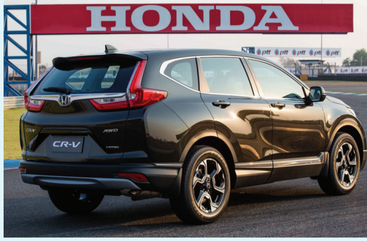
सिफिटिगियर, ८ प्रकारको पावर ड्राइभिङ सिट, ४ प्रकारको लम्बर सर्पोट सिट, उच्च चस्तरीय लेदर तथा ऊडन फिनिस क्याबिनका साथै उजना सम्म प्यासेन्जरहरू बस्न सकिने सुविधाहरू रहेको छ।

काठमाडौं - नेपालका लागि होण्डा कारको आधिकारिक विक्रेता स्याकार ट्रेडिङ कम्पनी प्रा. लि.ले स्टार्ट, पर्सनेन्स र सुरक्षालाई समावेश गरी परिष्कृत पर्सनेन्स र शानदार इन्टरियरसका साथै नयाँ इन्जिनसहित होण्डा सिआर-भि २०२० लाई नेपाली बजारमा लन्च गरेको छ। “एडभान्स, एनरजेटिक एण्ड स्मार्ट” को ग्राण्ड कन्सेप्टमा निर्मित ५ औं जनरेशनको यस होण्डा सिआर-भि २०२० माहाई-टेक्नोलोजीयुक्त एक्सट्रियर र इन्टरियर सुविधाहरूले सबैको ध्यानआकर्षण गर्नेछ। आफ्नो सेग्मेन्टमा सर्वाधिक २१० एमएम ग्राउण्ड क्लेरन्स रहेको यस कारमा एडभान्स इन्टिग्रेटेड लिड हेड ल्याम्पस, इनलाइन लिड फगल्याम्पस, फ्रन्ट पार्किङ सेन्सर, पुस बटन गियर सिस्टम, प्यानोरामा सनरूफ, स्मार्ट किलेस इन्टी, प्याडल