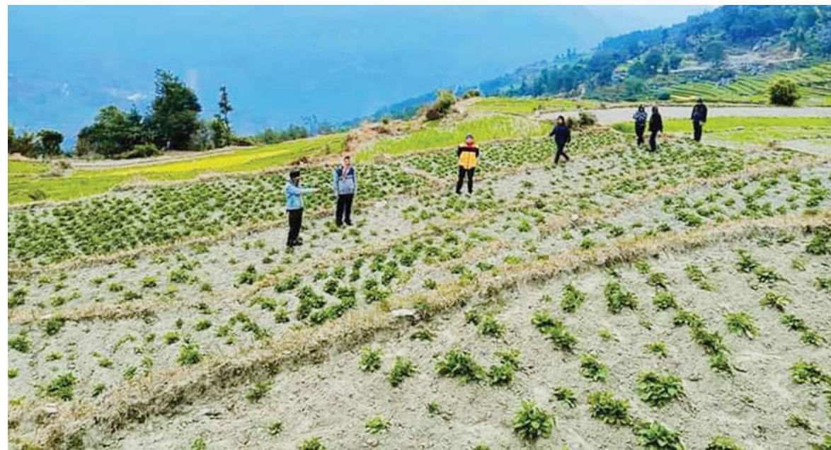
आलुखेतीको म्याग्दीको बेनी नगरपालिका-१ आम्बोटमा आम्बोट आमा समूहले गरेको सामूहिक आलु खेतीको निरीक्षण गर्दै बेनी नगरपालिकाका निरीक्षण कृषि प्राविधिक र कृषकहरू।