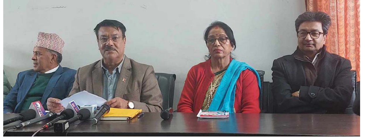
महासमिति बैठकको तयारीबारे जानकारी दिन बुधवार आयोजित पत्रकार सम्मेलन ।

● महाधिवेशनपछि विभिन्न समयमा नीति अधिवेशन गर्ने घोषणा गरेको कांग्रेसले अन्ततः महासमितिको बोरामित्रै नीति अधिवेशन लटरपटर घुसाएको हो