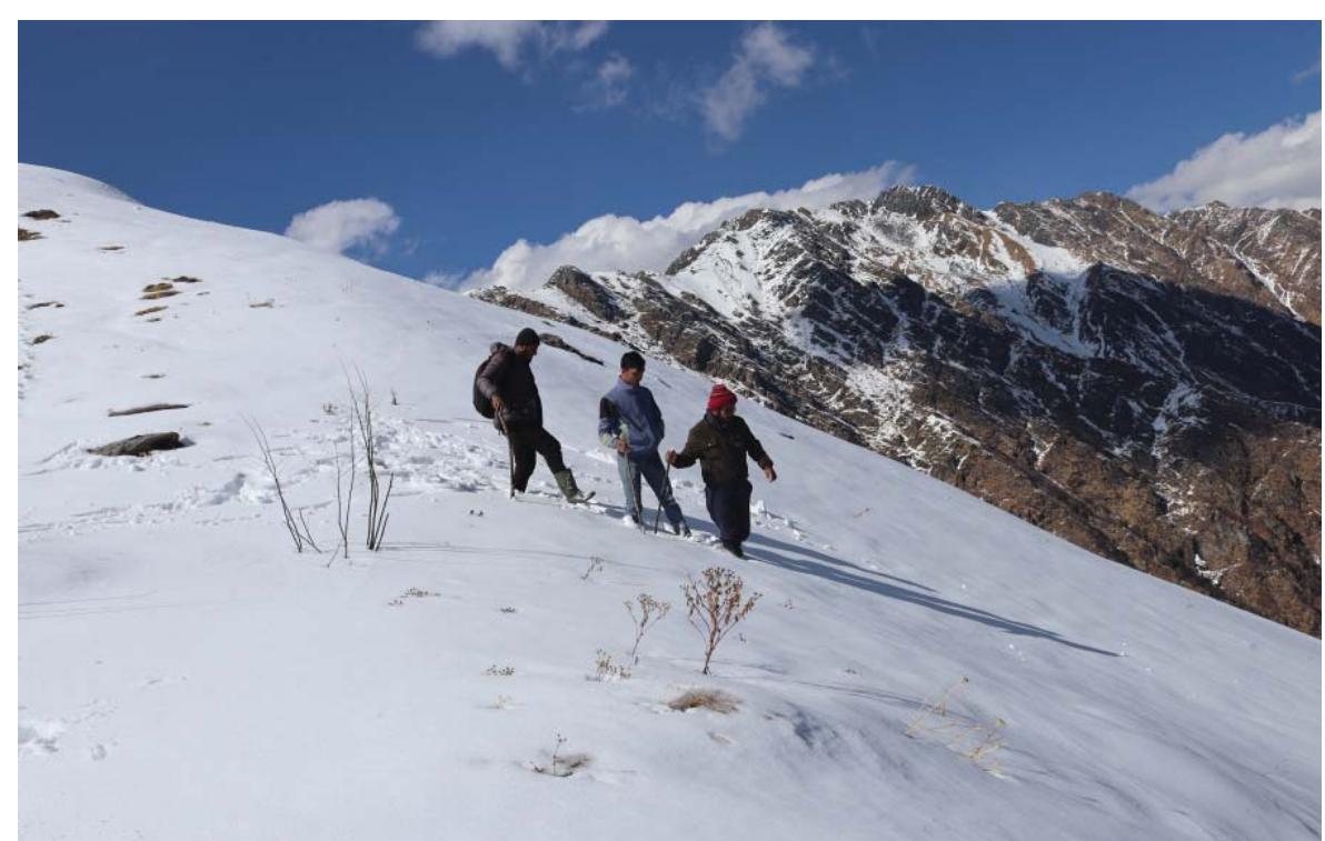
हिमाल नजिक पर्यटक | सुमा गाउँपालिका-४ मा पर्ने ठूली उकाली हिमालमा आन्तरिक पर्यटक रमाउँदै। चार जहार ५०० मिटर उचाईको ठूली उकाली हिमालमा बाहिमास हिउँ भइरहने हिमाल हो।