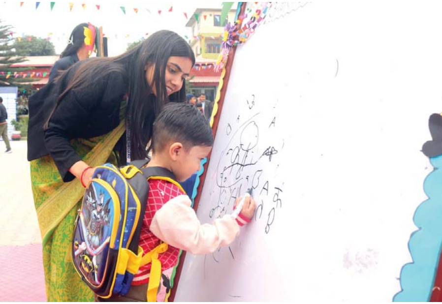
अक्षरारम्भ गराउँदै बटुल उपमहानगरपालिका-८ सुखानगरमा रहेको अक्सफोर्ड माध्यमिक विद्यालयमा बुधवार श्रीपञ्चमी तथा सरस्वती पूजाका अवसरमा बालकलाई अक्षरारम्भ गराउँदै।