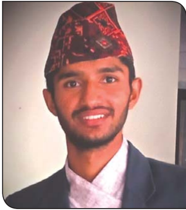
▶▶ शिव स्रितिवडा शिष्य