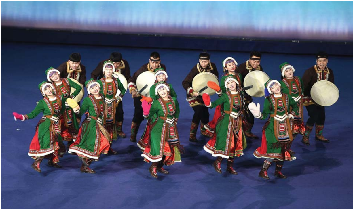
उत्तरी चीनको मंगोलिया स्वायत्त क्षेत्र हुलुन बुइरमा चीनको १४औँ राष्ट्रिय शीतकालीन खेलकुदको उद्घाटन समारोहअघि प्रस्तुति दिँदै कलाकार टोली।