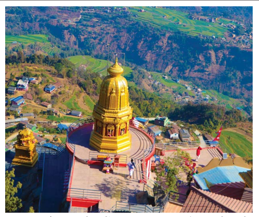
पर्यटकको पसार्इमा पञ्चकोट बागलुङको प्रसिद्ध धार्मिकस्थल पञ्चकोटमा रहेको गण्डकी माताको मन्दिर। मन्दिर वनेपछि पञ्चकोटमा दैनिक २ देखि ३ सयको हाराहारीमा पर्यटक आउने गरेका छन्।