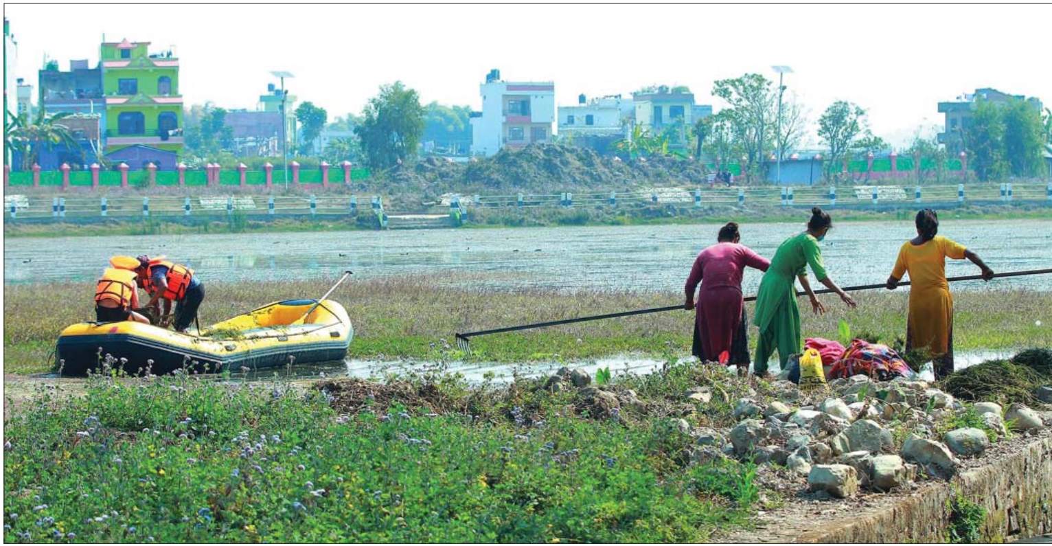
बुलबुले तालको सरसफाइ

कर्णाली प्रदेशको राजधानी सुर्खेतको वीरेन्द्रनगरमा रहेको प्रमुख पर्यटकीयस्थल बुलबुले तालको सरसफाइ गरिँदै । तालभित्रको फोहोर र घाँसहरू हटाएर अब केही दिनमा ढुंगा चलाउने तयारी रहेको वीरेन्द्रनगर नगरपालिकाले जनाएको छ ।