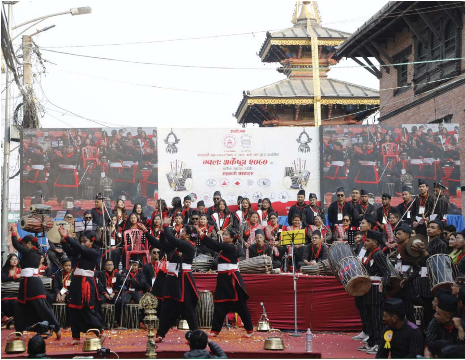
ग्वल: अर्कोस्टामा नृत्य प्रस्तुति