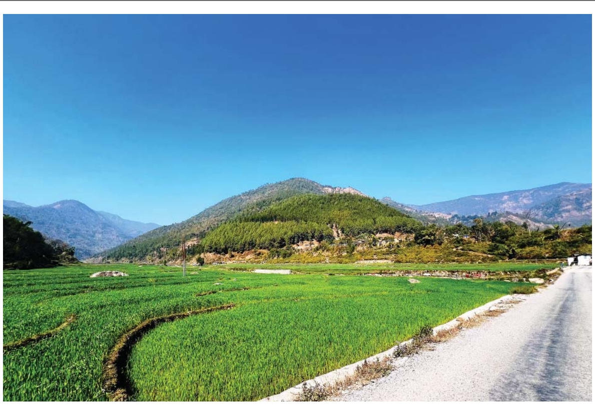
गहुँ हरियो... भेरी नगरपालिका-१ होलुखोला स्थित भेरी करिडोरको बीचमा लगाइएको गहुँवाली। जिल्लाको सबै भन्दा बढी लिँचाइ सुविधा भएको र उत्पादनसमेत राम्रो हुने क्षेत्रको रूपमा लिइएको छ।