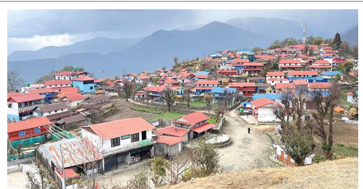
पर्यटकीय समुद्री सतहदेखि दुई हजार १०० मिटर उचाइमा रहेको प्राकृतिक छटाले भरिपूर्ण, लमजुङ हिमालको काखमा अवस्थित घलेगाउँ। घलेगाउँ वि.सं. २०५७ बाट सञ्चालित घरवासमा प्रतिवेला यहाँ ४४ घरधुरीमा घरवास कार्यक्रम रहेको छ।