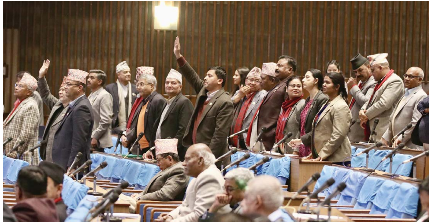
शुक्रबार प्रतिनिधिसभा बैठक अवरुद्ध गर्दै प्रमुख प्रतिपक्षी दल नेकपा एमालेका सांसदहरू।