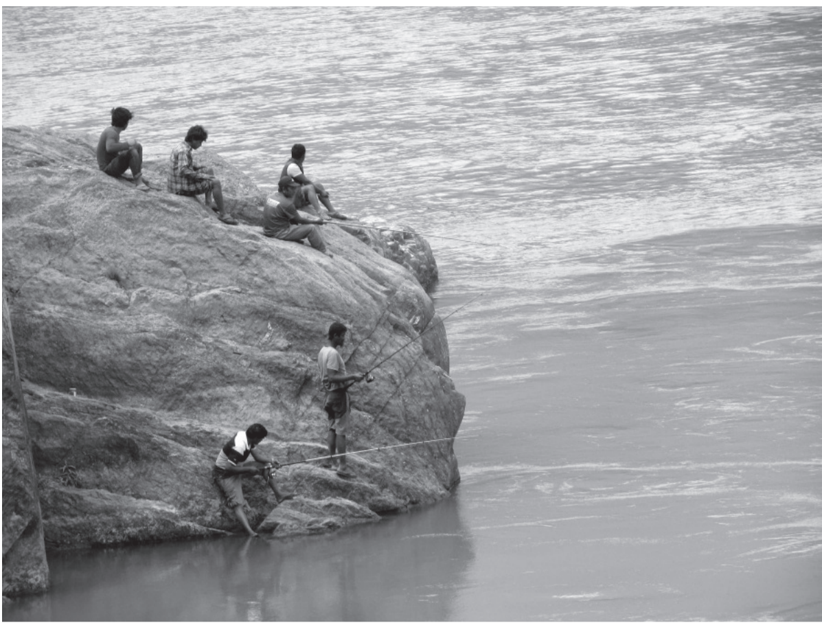
बल्छी थापेर माछा मादैं स्थानीयवासी | त्रिशुली नदी सलैपछि नदितर्फ मानिसको आकर्षण बढेको छ । कोरोना भाइरस (कोभिड-१९) बाट बचाउन गरिएको बन्दाबन्दी (लकडाउन) पछि पर्यटकीय नदि त्रिशुली कञ्चन सल्लो भएको छ । त्रिशुली नदि सफा र कञ्चन भएपछि नदीमा बल्छी थापेर माछा मादैं स्थानीयवासी ।