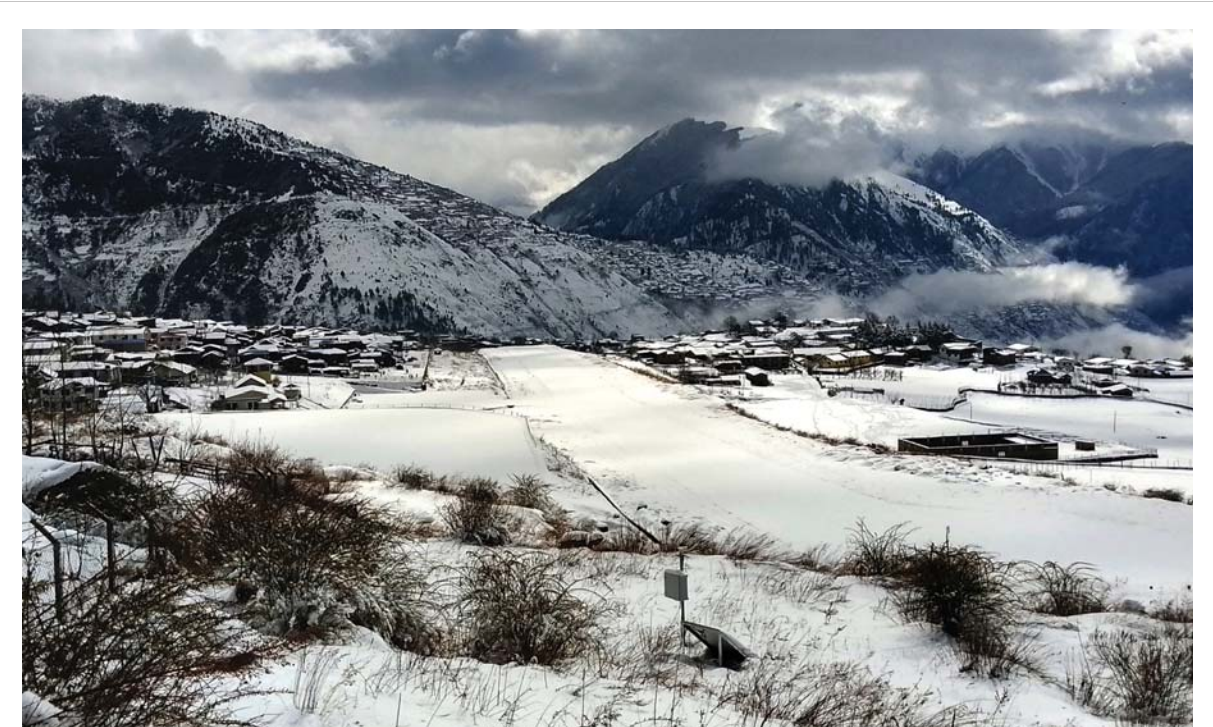
हिउँले छोपिएको हुम्लामा आइतबार राति हिमपात हुँदा सोमबार दिउँसो अवरुद्ध भएको सिमकोट विमानस्थलसहित आसपासका क्षेत्र। हिमपातका कारण उडान पूर्ण प्रभावित बनेको थियो।