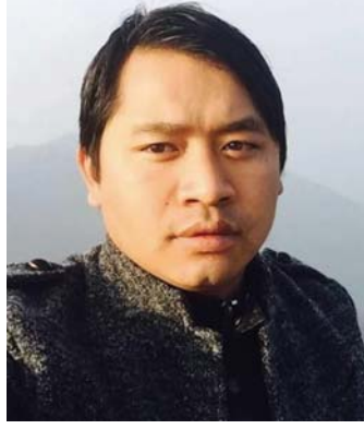
प्रतिवेदनमा पनि पुनको संलग्नता औल्याएको छ ।