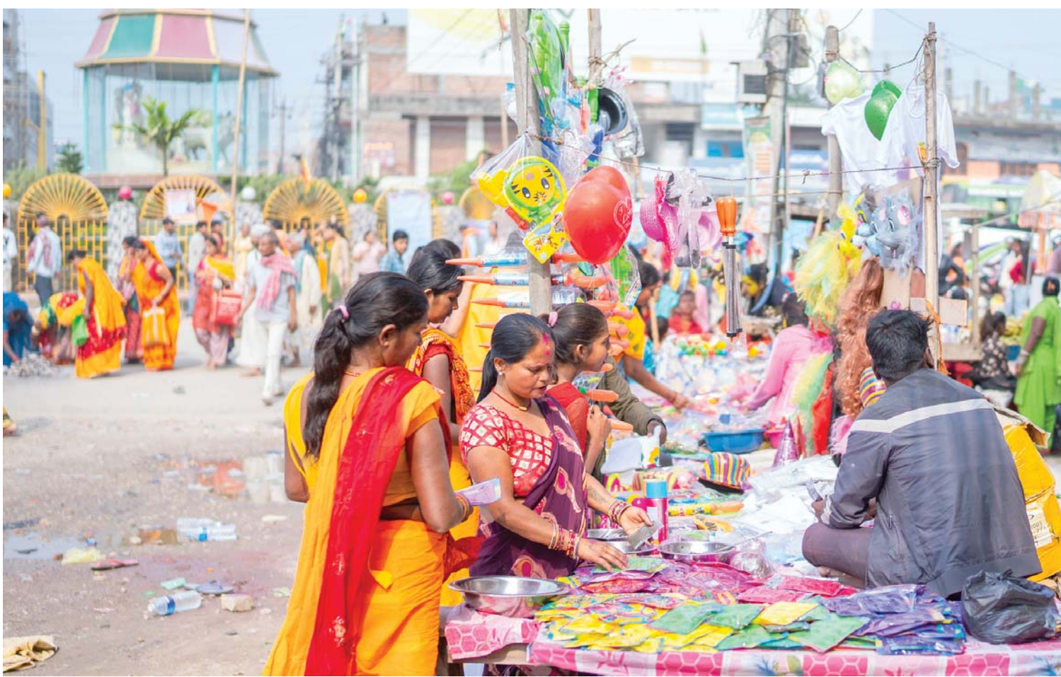
होलीको व्यापार | जनकपुरधामको पिडारी चोकमा सोमबार होली खेल्न रड खरिद गर्दै स्थानीय।